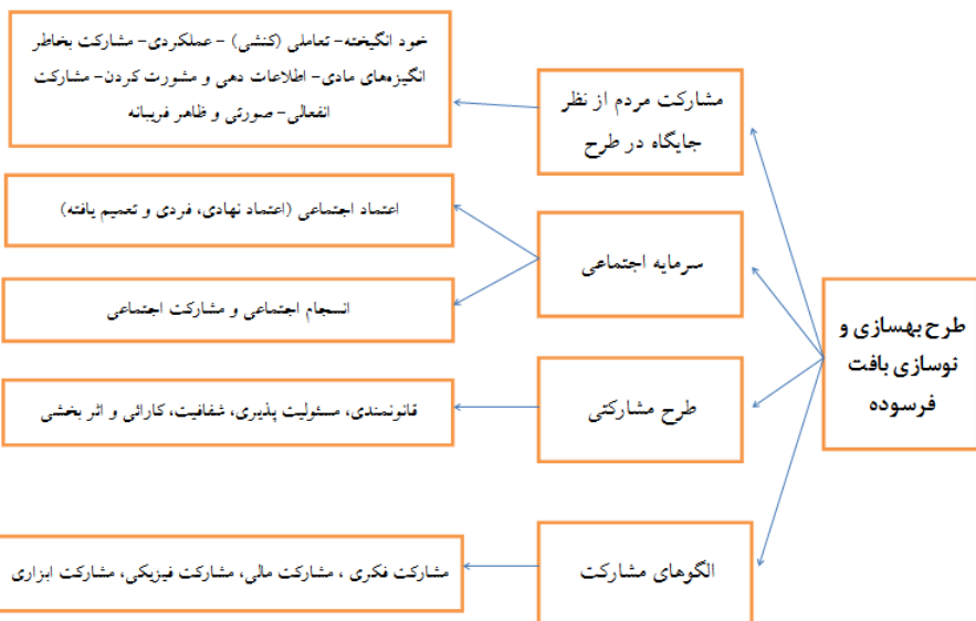
شکل شماره ۱. مدل تحلیلی پژوهش