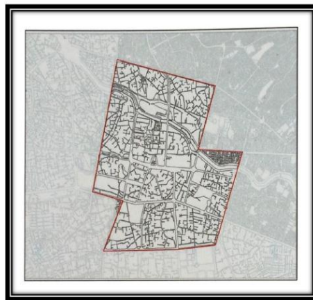
تصویر شماره ۱: منطقه ۸ تبریز

منطقه تحت مطالعه از لحاظ تقسیم بندی طرح جامع منطقه ۶ (منطقه تاریخی - فرهنگی) و در تقسیم بندی مناطق شهرداری تحت پوشش منطقه ۸ شهرداری می باشد که در مرکز شهر قرار گرفته و عناصر اولی شکل دهنده تبریز در آن واقع شده است. که شامل بازار مراکز مهم سیاسی اداری و عناصر تاریخی است. مهمترین جلوه تاریخی شهر که در این منطقه قرار دارد باروی قدیم شهر می باشد که بجز یک مسیر و دو دروازه نشانه ای از آن نیست شهر تبریز از ابتدا در این محدوده شکل گرفته و از این رو محدوده در برگیرنده نمادهای تاریخی شهر است در شرایط فعلی نیز محدوده داخل بارو و هسته اصلی فعالیت و اقتصاد شهر تبریز است.