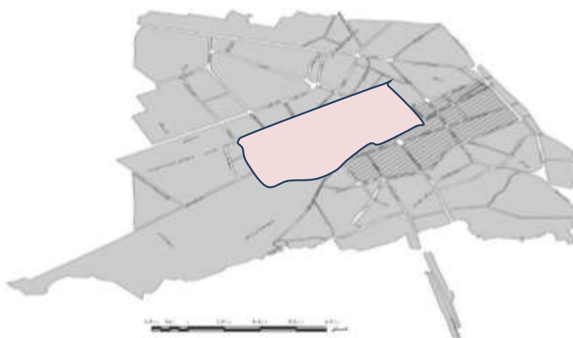
نقشه شماره ۱. محدوده بافت فرسوده و قدیمی شهر کاشان