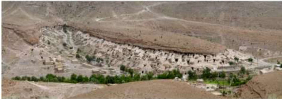
شکل (۱): روستای صخره‌ای میمند (معصومی، ۱۳۸۵، آنلاین)

از مهم ترین مولفه‌های تاریخی شهر بابک می توان به روستای میمند اشاره کرد. این روستا در فاصله ۳۶ کیلومتری شمال شرق شهر بابک در استان کرمان واقع شده است. روستای میمند در فصل مشترک دو تپه اصلی با شیبی نسبتاً تند که ارتفاع متوسط آن حدود ۸۰ متر است قرار دارد. مقطع طولی روستا شکلی شبیه به حرف (V) انگلیسی با دهانه نسبتاً باز دارد (شکل ۳). عرض دهانه بین ۸۰ تا ۲۰۰ متر متغیر است. سکونتگاه‌های روستاییان به صورت حفره‌هایی در بدنه‌های شیب دار این تپه‌ها قرار گرفته‌اند. شکل (۱)