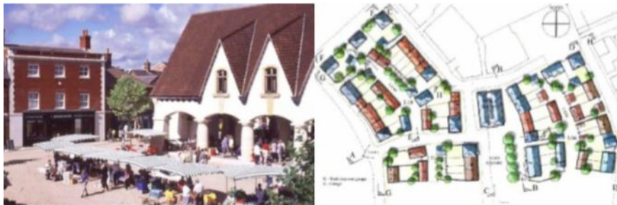
شکل شماره (۱). دهکده شهری کلوین گرو

دهکده شهری کلوین گرو در شمال منطقه بریسبین در استرالیا واقع شده و حدود سه کیلومتر از مرکز تجاری کوئینزلند فاصله دارد. این منطقه تپه‌ای، نامش را از پارک کلوین گرو واقع در شهر گلاسگو در اسکاتلند گرفته است. در ابتدا شهرک مسکونی ساده‌ای بود که تعداد اندکی فروشگاه و کارگاه نیز در آن واقع شده بود. بر طبق آمار رسمی در آن زمان تعداد ۴۱۱۳ نفر در آنجا سکونت داشته‌اند. تلفیقی از ابنیه سنتی کوئینزلند، کلبه‌های روستایی و تعداد زیادی ساختمان‌های مدرن در آن وجود دارند. در دهکده شهری کلوین گرو مردم در هر سن و با هر سبک و مقام اجتماعی به راحتی زندگی می‌کنند (شهر همه شمول)، فاصله میان مکان زندگی و اشتغال خویش را به صورت پیاده طی می‌کنند، امکانات اوقات فراغت نظیر سالن‌های تئاتر، باشگاه‌های ورزشی، رستوران‌ها، مراکز خرید جذاب و ... در آن مهیا هستند و به طور خلاصه می‌توان این گونه بیان کرد که در کلوین گرو، ترکیب سنت و نوآوری باعث خلق مکانی امن، مطلوب و جذاب شده است. از لحاظ برنامه‌ریزی و طراحی جامع، طرح و پلان کلوین گرو یکی از بهترین نمونه‌های طراحی و توسعه شهری پایدار است. اصول و دستورات عمل‌های طراحی آن براساس اصول توسعه پایدار اکولوژیکی بنا نهاده شده است.