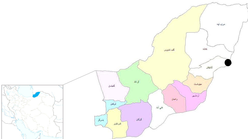
نقشه شماره (۱). موقعیت قرارگیری شهر صادق آباد

موقعیت قرارگیری: صادق شهر به عنوان یکی از شهرهای شهرستان گالیکش، در فاصله ۲۵ کیلومتری از مرکز این شهرستان در جاده گالیکش به مشهد و در شرقی‌ترین نقطه استان و در شمال شرقی نقشه جمهوری اسلامی ایران واقع شده‌است. این شهر که سال‌های نزدیک مرکزیت بخش لوه و نام "صادق آباد" را با خود به یاد می‌کشید.