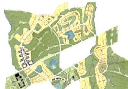
شکل شماره (۳). دهکده شهری لینکلند در ایالت متحده آمریکا

مهمترین دستورالعمل‌های این طرح را می‌توان در موارد زیر خلاصه نمود: