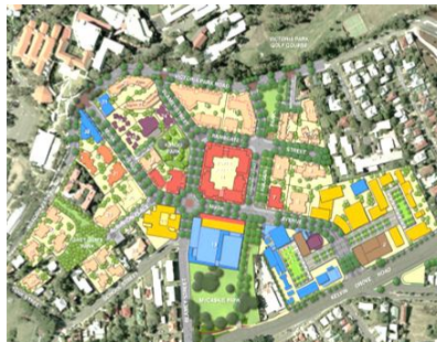
شکل شماره (۲). کاربری در دهکده شهری کلوین گرو

دهکده شهری کلوین گرو در استرالیا، مجموعه‌ای با کلیه خدمات مسکونی، آموزشی، تجاری و تفریحی، به مساحت ۱۶ هکتار می‌باشد که طرح آن از سال ۲۰۰۲ آغاز شد و در سال ۲۰۱۰ میلادی مراحل توسعه تکمیلی خود را سپری می‌کند.