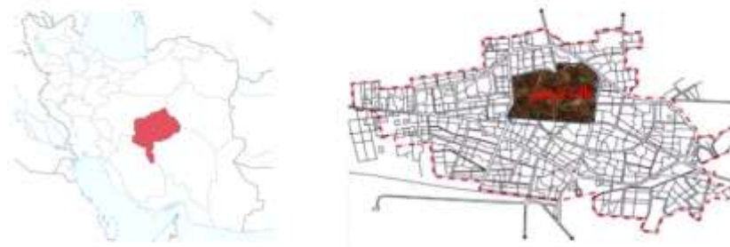
نقشه ۱. بافت تاریخی و فرسوده شهر یزد

شهر یزد در دشت وسیع یزد - اردکان قرار دارد و محصور بین ارتفاعات منفرد مرکزی خرائق در شرق و شمال شرق و "شیرکوه" در غرب و جنوب غربی و و کویر سیاه کوه " بخشی از کویر مرکزی در شمال است . مساحت شهر ۸۷ کیلومتر مربع است و ارتفاع متوسط آن از سطح دریا ۱۲۳۰ متر می باشد. جمعیت شهر یزد در سال ۱۳۵۵ برابر با ۱۳۵۹۲۵ نفر بوده است که تا به امروز روندی رو به رشد داشته و براساس آخرین سرشماری جمعیت آن به ۵۲۹۶۷۳ نفر در قالب ۱۵۸۳۶۸ خانوار رسیده است. ناحیه تاریخی شهر یزد شامل اصلی ترین محلات قدیمی حدفاصل خیابان دهم فروردین و شهید رجایی در جنوب، بلوار دولت آباد و شهید سعیدی در غرب، بلوار بسیج و دهه فجر در شرق و خیابان فهادان، ده متری بعثت و کوچه سراج در شمال است که براساس توافق بین دفتر بهسازی بافت قدیم، دفتر طرحریزی شهری وزارت مسکن و شهرسازی و سازمان مسکن و شهرسازی استان یزد به علت ارزش های فرهنگی و هویتی خاص، ناحیه تاریخی نام گرفته و شهرداری ناحیه تاریخی و میراث فرهنگی در آن محدوده فعالیت دارند