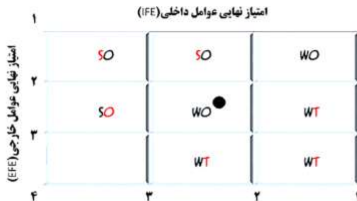
شکل ۱. ماتریس ارزیابی عوامل داخلی و خارجی محدوده تاریخی و فرسوده شهر یزد

پس از تدوین استراتژی های اولیه از مقایسه عوامل داخلی و خارجی در ماتریس SWOT استراتژی های مطلوب و قابل قبول از میان این استراتژی های اولیه انتخاب می گردد. ماتریس استراتژی ها و اولویت های اجرایی دارای دو بعد اصلی می باشد. جمع امتیازهای نهایی عوامل داخلی محدوده بافت تاریخی شهر یزد که بر روی محور Xها نمایش داده شده و جمع امتیاز نهایی عوامل خارجی بر روی محور Yها نوشته شده است. نقطه تلاقی جمع امتیازهای حاصل عوامل داخلی و خارجی شهر بر روی محور X و Yها تعیین کننده موقعیت این بخش در ماتریس استراتژی ها و اولویت های اجرایی است.