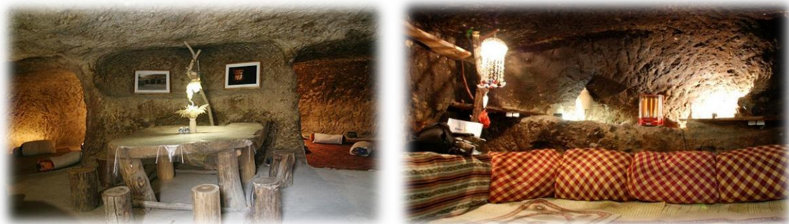
شکل ۲. نمای داخلی خانه‌ها در روستای میمند کرمان

روستای میمند شهربابک روی هم رفته دارای ۴۰۶ کیچه و ۲۵۶۰ اتاق است. ساکنان این روستا دارای آداب و رسوم خاص هستند و در زبان و گویش آن‌ها هنوز از کلمات پهلوی ساسانی استفاده می‌شود. روستای ۳ هزارساله میمند شهربابک تنها روستای تاریخی در جهان است که هنوز روابط سنتی زندگی در آن جریان دارد و می‌توان تعامل انسان و طبیعت در هزاره دوم میلادی را به خوبی در آن دید.