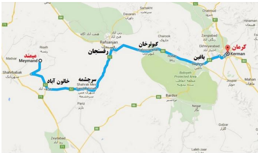
نقشه ۱. موقعیت قرارگیری روستای میمند کرمان

تاریخچه: میمند شهر بابک روستایی صخره‌ای و دستکند با چند هزار سال قدمت یادآور ایامی است که انسان‌ها خدایان خود را بر فراز کوه‌ها جستجو می‌کردند و کوه نماد استواری، توان، پایداری و اراده شناخته می‌شد. این بنای دستکند باستانی، بی‌گمان از نخستین سکونتگاه‌های بشری در ایران به شمار می‌رود، دورانی که هنوز ایرانیان مهرپرست بودند و کوه‌ها را مقدس می‌شمردند. به هر تقدیر چند هزار سال پیش از این، انسان‌ها دل سنگ‌ها را شکافتند و یادگاری را به جا گذاشتند، که امروزه پس از گذشت سال‌ها همچنان نماد عزم، اراده و اقتدار اجداد ایرانی به شمار می‌رود. هنوز کسی به درستی آگاه نیست که این مجموعه به دست چه کسانی به وجود آمده و انگیزه این مردم از ساخت چنین بناهایی چه بوده است.