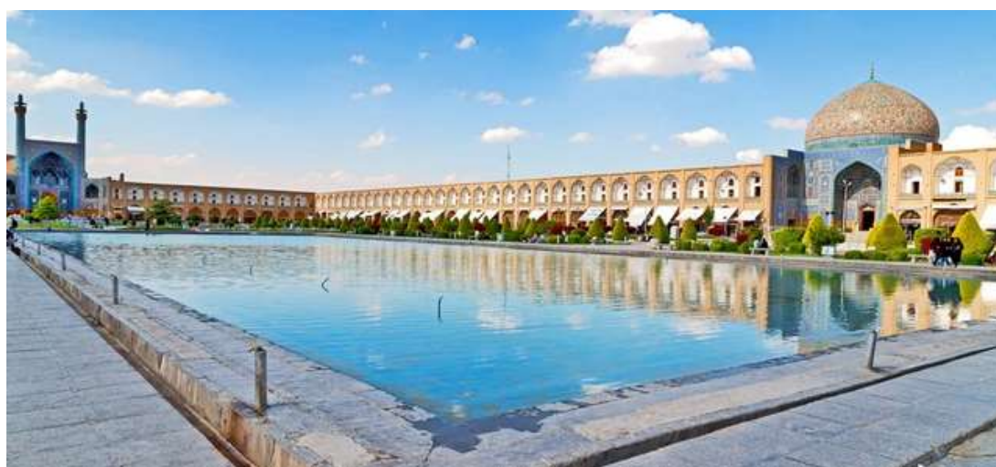
شکل ۱. جاذبه های گردشگری اصفهان

در بعد پتانسیل های گردشگری در شهر اصفهان باید گفت که این شهر جامع جاذبه های گردشگری است که یک شهر می تواند داشته باشد از پتانسیل هایی طبیعی گرفته تا صنایع دستی و جاذبه های تاریخی و فرهنگی مذهبی و .... جهت بررسی وضعیت توسعه گردشگری در این شهر نیاز است تا آمار گردشگران در این شهر بررسی گردد که آمار آن مطابق جدول ۲ می باشد: