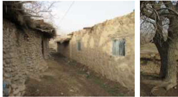
اشکال شماره (۶-۷) طراحی معابر کم‌عرض و باریک در معماری ساردوئیه