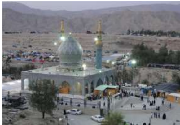
شکل شماره (۸): امامزاده سلطان سید احمد (خبرگزاری تسنیم، بارگزاری: تیر ۱۳۹۸)

می آیند به علت پخش بودن شکار در سرتاسر این منطقه بیش از یک روز و یا حتی یک شب در جایی توقف می کنند. (۴) در صورت احداث امکانات لازم، برگزاری همایش ها و فستیوال های فرهنگی آیینی محلی نیز باعث جذب گردشگران ویژه و اقامت آنها در طول مدت برگزاری می باشد، این مدت نیز بین ۱ یا چند روز متغیر است. همانطوریکه گفته شد دستیابی به هدف نهایی که این مجموعه اقامتی - توریستی می باشد، نیازمند برخورداری از یک سلسله اهداف عملیاتی است که شامل موارد ذیل می باشند: الف- توجه به حوزه بندی و حفظ قلمروها: به علت برخورداری مجموعه از بخش های گوناگون با عملکردهای متفاوت، توجه به قلمروهای هر کدام در جهت جلوگیری از اغتشاش و در هم پیچیدگی عملکردی ضروری است. ب- برخورداری از سلسله مراتب فضایی به منظور هدایت بازدیدکنندگان و تأمین محیطی آرام و دلپذیر و در ضمن خوانا رعایت سلسله مراتب فضایی در مجموعه لازم می باشد. ج- سهولت ارتباطات: برای ایجاد امکان استفاده سهل و راحت میهمانان از قسمت های مختلف مجموعه، فضاهای ارتباطی مشخص و به هم پیوسته با ویژگی های فیزیکی متناسب جمعیت بازدید کننده، ضروری است. د- ایجاد تجهیزات خدمات و زیربنایی: ایجاد تجهیزات، تأسیساتی فضاهای جنبی که با خدمات رسانی مستمر، عنایت اصلی مجموعه را در پاسخگویی به عملکردهای محوله هر چه موفق تر بسازد، امری است اجتناب ناپذیر. ه- هماهنگی فضایی یا برنامه کالبدی