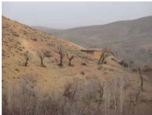
شکل شماره (۳): نمونه‌ای از معماری در رده کوهستانی با شیب تند در منطقه ساردوئیه (نگارنده)

معماری روستایی در ایران، به لحاظ ماهیت کارکردی و پاسخگویی به نیازهای انسانی، فعالیت‌های مردمی، عناصر تولیدی و محیط زیست، مجموعه‌ای همگن و متشکل با هویت کالبدی خاص را تشکیل می‌دهد که تجلی‌کننده ارتباطات و کارکردها و نقش چند عملکردی فضاهاست. (سرتیپی پور، ۱۳۸۴: ۴۴). بافت روستا را می‌توان متشکل از شبکه معابر به اضافه عملکردهای مختلف مانند مسکن، مدرسه، مسجد دانست که این شبکه از نظر فرهنگی و اجتماعی بیانگر سکونت باشد (گودرزی، ۱۳۸۲: ۱۳). در مناطق کوهستانی زاگرسی نحوه استقرار و بافت روستا به‌طور عمده در سه رده به لحاظ توپوگرافی قرار می‌گیرند. (۱) رده کوهستانی با شیب تند. (۲) رده کوهپایه‌ای با شیب متوسط. (۳) رده دشتی با شیب ملایم. بر اساس این سه رده، ساختار و بافت روستا متفاوت بوده و هر یک دارای ویژگی‌های مختص خود می‌باشد. در رده‌های کوهستانی و کوهپایه‌ای اکثر روستاها در اطراف دره‌های کم‌عرضی با شیب متفاوت واقع شده‌اند. جهت عمده ساختمان‌ها رو به سمت جنوب و جنوب شرقی بوده تا بیشترین بهره‌مکن از تابش آفتاب میسر باشد. در بسیاری از موارد در یک سمت دره، خانه‌های مسکونی و در سمت دیگر، زمین‌های محدودی که به باغداری و کشاورزی اختصاصی یافته، مستقر می‌باشند (مولانایی، ۱۳۸۴: ۱۹۶). (شکل شماره ۳).