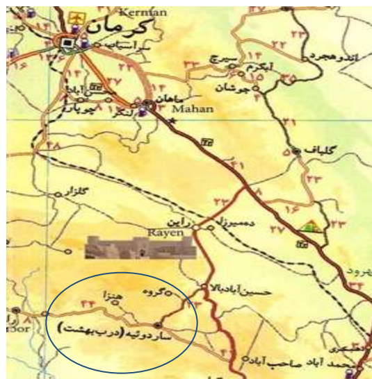
شکل شماره (۲): نقشه موقعیت جغرافیایی منطقه ساردوئیه (اطلس ملی ایران «گردشگری» سازمان نقشه برداری کشور، بازنگری، اردیبهشت ۱۳۹۸)