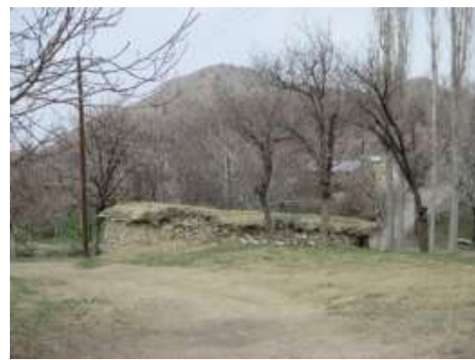
شکل شماره (۴) سمت راست: نمونه‌هایی از بافت متراکم و فشرده در معماری ساردوئیه (نگارنده)