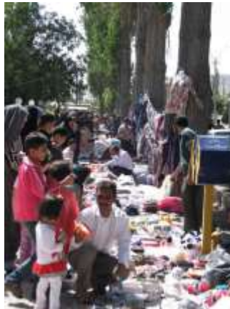
اشکال شماره (۶- ۷- ۸): نمونه هایی از گردشگری در منطقه (نگارنده)