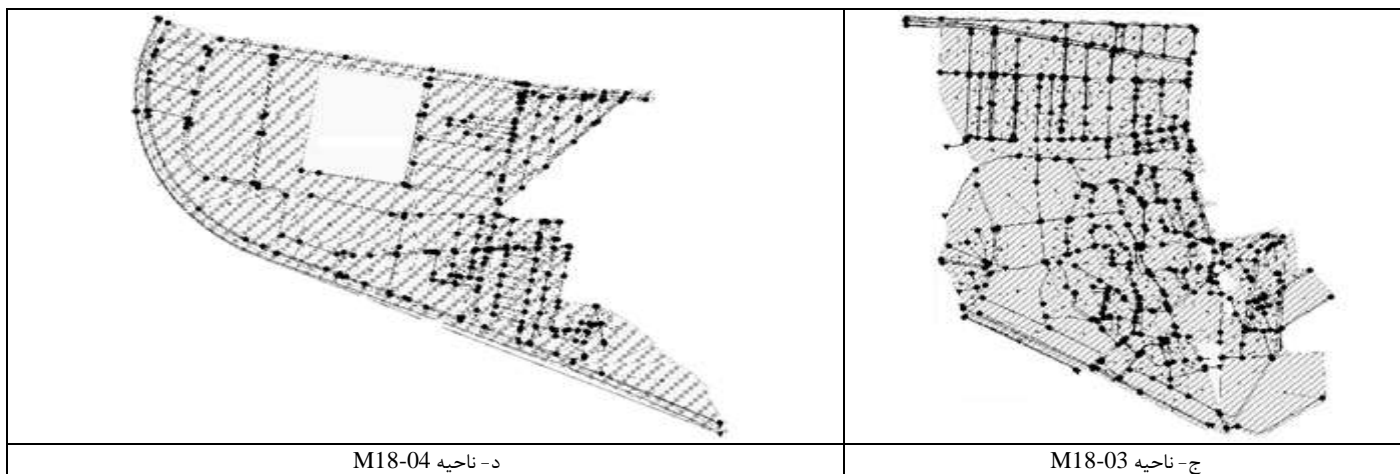
شکل ۳- تصاویر شماتیک مدل سازی شده نواحی مختلف در برنامه SWA