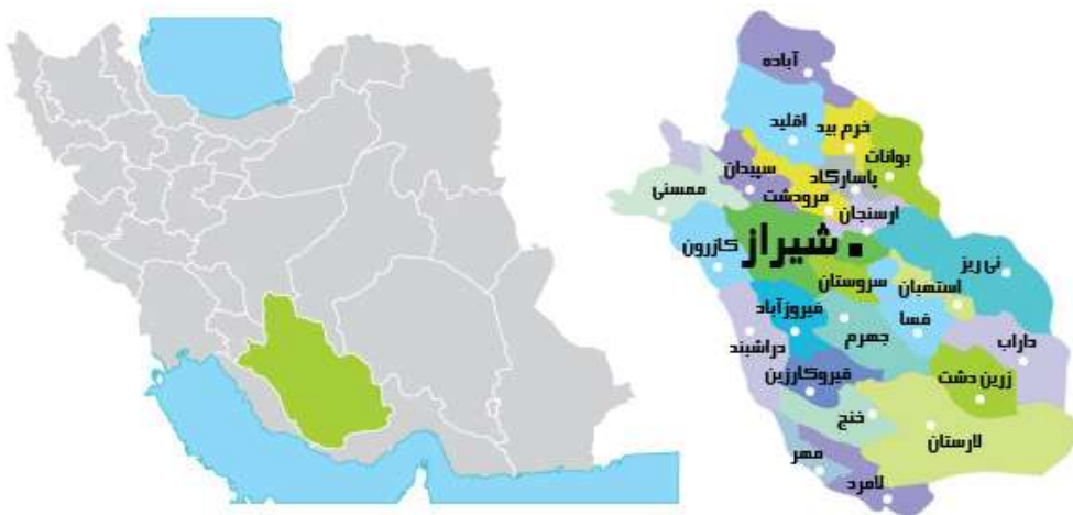
شکل (۱) موقعیت شهر شیراز و استان فارس

سال ۱۳۹۵، جمعیت شهر شیراز ۱۵۶۵۵۷۲ نفر می‌باشد (مرکز آمار ایران). شکل (۱) موقعیت شهر شیراز و استان فارس را نمایش می‌دهد.