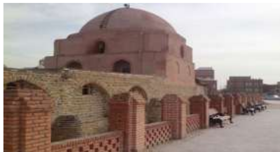
شکل ۲. مسجد جامع ارومیه

مسجد جامع ارومیه که به مسجد رضائیه معروف است، یکی از مراکز و مدارس دینی معروف آذربایجان غربی می‌باشد و در مرکز شهر در وسط بازار قرار دارد. مسجد جامع ارومیه از بناهای نیمه دوم سده هفتم هجری قمری است که در دوره‌های مختلف بازسازی و تکمیل شده تا به صورت امروزی درآمد است.