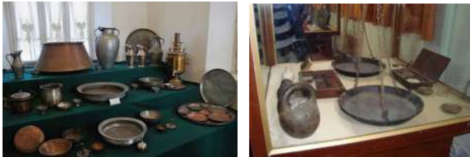
شکل ۳. موزه تاریخی ارومیه

موزه ارومیه در خیابان شهید بهشتی شهر ارومیه قرار دارد و با توجه به غنای اشیای تاریخی نگهداری شده در آن، دومین گنجینه بزرگ تاریخی کشور به شمار می‌رود. این موزه در سال ۱۳۴۶ خورشیدی، با زیر بنای ۷۵۰ متر مربع در محوطه‌ای به وسعت ۲۰۰۰ متر مربع احداث شد و بعدها به منظور حفظ و نگهداری آثار و اشیای منحصر به فرد و در راستای گسترش موزه، دو فضای نسبتاً بزرگ و یک گنجینه زیرزمینی به آن افزوده شد