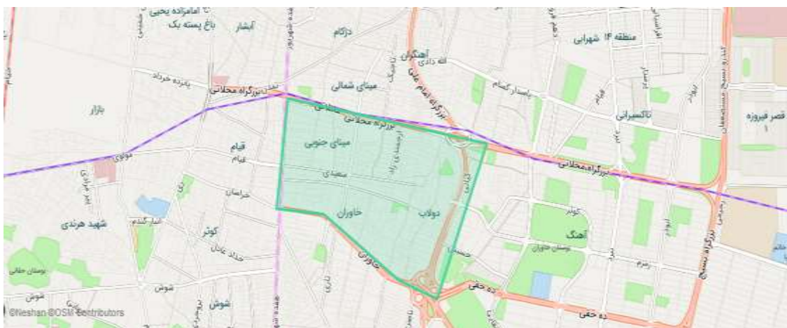
شکل 2- موقعیت محله سرآسیاب در منطقه 14 تهران