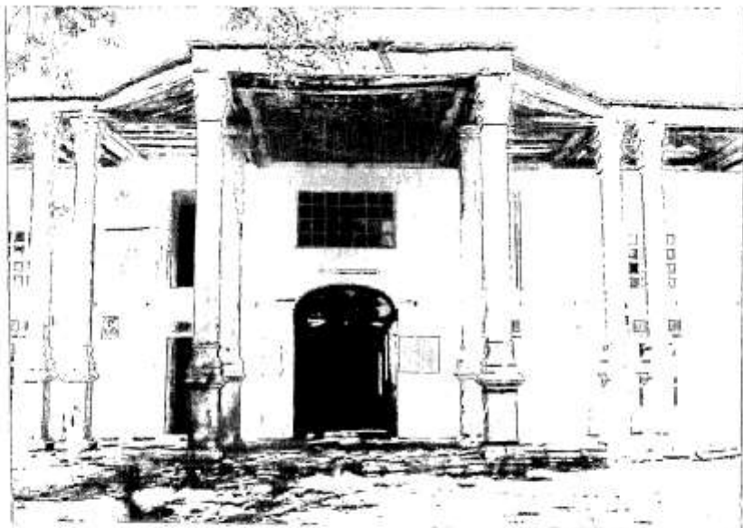
شکل شماره (6) : نمایی از ایوان ستوندار

این ایوان 18 ستون دارد که 2 ستون آن به صورت پیشخوان دو ستونی در جلو قرار گرفته اند و در وسط دو ستون و به فاصله 20 متر جلوتر نیز 2 ستون قرار گرفته است و از هر طرف از ستون‌های میانی 7 ستون قرار دارد که ابتدا و انتهای ایوان و ستون‌های مابقی میانی‌ها بصورت جفتی می باشد.