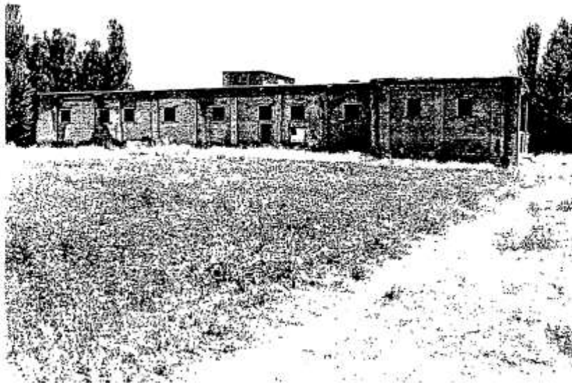
شکل شماره (5): نمایی جبهه شمالی قلعه شلمزار

این قلعه به دست صدر اعظم ایران در دوره مشروطه نجفقلی خان ملقب به صمصام السلطنه در استان چهارمحال بختیاری ساخته شد و در دوران مشروطیت محل تجمع و آمادگی آزادیخواهان و سواران بختیاری برای شرکت در جنگ‌های مشروطیت بود. صمصام السلطنه در این زمان جزو افرادی بود که به اروپا سفرهای بسیار داشته و به دلیل شرایط مناسب مالی خود در آن زمان، معماری خانه‌ی خود را تحت تاثیر اوضاع غالب دوره قاجار و به تقلید از معماری اروپایی بنا کرد. این قلعه در غرب شهر شلمزار و مانند قلعه‌های دیگر این منطقه در میان باغ‌های میوه و زمین‌های کشاورزی واقع شده است. این قلعه منزل مسکونی و محل حکمرانی صمصام السلطنه بوده است. این بنا دارای دو طبقه شامل اعیانی، اندرونی، دوبرج، سرطوبله، اصطبل، انبارهای متعدد و ... بوده است که به مرور زمان تخریب شده است و از طبقه دوم که شامل اعیانی که دارای اطاق‌های آینه، پنج دری، گچ بری و نقاشی‌های دیواری و سایر عناصر تزئینی بوده چیزی باقی نمانده است. و امروزه طبقه همکف اعیانی، حصار و بقایای برج شرقی از بنا باقی مانده است. این قلعه در جهت شرقی غربی ساخته شده و ایوان ستوندار آن رو به جنوب است. جبهه شمالی که پشت به باغ‌ها و مزارع کشاورزی است فاقد درب می باشد و نمای آن جرزهای پیش آمده و پنجره‌هایی است که در ارتفاع بیش از 2 متر از سطح زمین قرار گرفته اند.