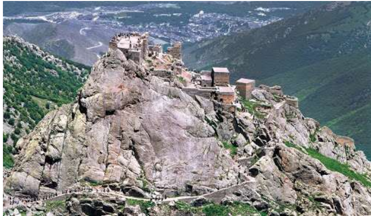
شکل شماره (2) : نمایی از دژ کوهستانی در ایران

قلعه‌های کوهستانی از سنگ‌های بدون تراش همراه با گچ غربال استفاده می شده است. اطراف این قلعه‌ها پرتگاه‌های عمیقی در قسمت انتهایی برج‌ها کنگره‌هایی مخصوص کمانداران تعبیه شده و همین بلندی‌ها، حمل ادوات محاصره‌ای به پای دیوارها را دشوار و تسلط محافظان قلعه و سربازان بر مهاجمان را بیشتر می کرد (کیانی، 1385: 18).