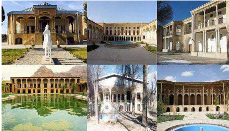
شکل شماره (4): نمایی از قلعه های مختلف شلمزار

ایلخانی تحت تیول وی قرار گرفته و به عنوان قلمرو حکومت وی شناخته شدند. قلعه‌های دیدنی و معروف استان چهارمحال و بختیاری قلعه چالشر، قلعه سردار اسعد بختیاری، قلعه امیرمفخم دزک، قلعه صمصام السلطنه شلمزار، قلعه بارده، قلعه امیر مجاهد و... می باشد.