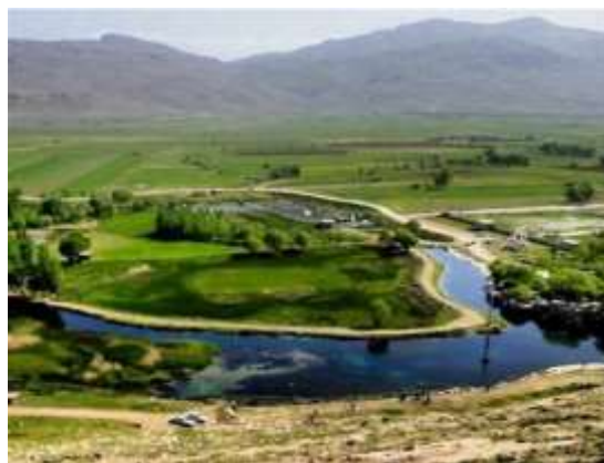
شکل شماره (3) : نمایی از شلمزار مرکز شهرستان کیار

شلمزار در ۳۵ کیلومتری جنوب شهرکرد در استان چهارمحال و بختیاری است. کیار مرکز شهرستان شلمزار است که از شمال با شهرستان شهرکرد، از غرب با شهرستان‌های فارسان و اردل و از جنوب با شهرستان لردگان و از شرق با شهرستان بروجن هم مرز می باشد. شلمزار به معنی کتیرا زار یعنی جایی که کتیرا در آن بسیار می‌روید می‌باشد اکنون نیز گیاه کتیرا در کوه‌های اطراف وجود دارد. شلمزار در دشتی پهناور قرارداد و از منابع آبی فراوان برخوردار می باشد. یکی از ویژگی‌های شلمزار دارا بودن سابقه‌ی برجسته‌ی تاریخی و بناهای تاریخی در آن می باشد.