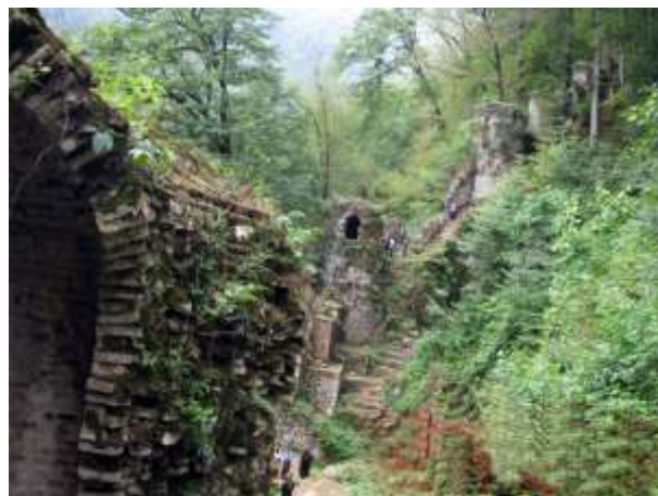
شکل شماره (1) : نمونه ای از دژهای جلگه ای

قلعه های ایران با توجه به موقعیت جغرافیایی و وضعیت آب و هوایی به دو صورت جلگه ای و کوهستانی بود، به همین دلیل مصالح ساختمانی به کار رفته در آنها نیز متفاوت بود. قلعه های جلگه ای معمولاً به صورت مربع یا مربع مستطیل با برج هایی به صورت مدور در چهار گوشه برای دفاع ساخته می شد. و مصالح این قلعه ها بیشتر گل و خشت از آجر و گچ کمتر استفاده می شد. دیوارهای ضخیم آن (باور) به صورت چینه با خشت های قطور ساخته شده است. برای استحکام بیشتر در اکثر موارد قطر و ضخامت بعضی از این باروها به چهار متر نیز می رسید. اطراف بعضی از این قلعه ها خندق حفر می شد و برای رسیدن به قلعه از پل های متحرک استفاده می شد. خانه ها در این قلعه ها به صورت دو طبقه بوده و از طبقه اول برای نگهداری دام و یا انبار مواد غذایی و آشپزخانه و طبقه دوم نیز به عنوان اتاق های نشیمن بوده است.