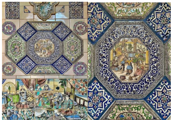
گ امامزاده یحیی