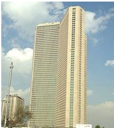
شکل 1- نمای بیرونی بلندترین برج مسکونی ایران در تهران