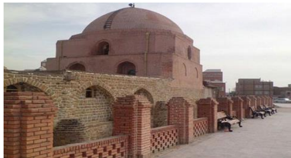
شکل 2. مسجد جامع ارومیه

جاذبه‌های شهر ارومیه به دریاچه آن محدود نمی‌شود. این شهر دارای مناطق طبیعی منحصر به فرد و زیبا و دارای تاریخی غنی است که به بیش از ۳ هزار سال پیش برمی‌گردد و مردمی با فرهنگ که موجب می‌شود سفر به آن با خاطراتی شیرین و به یاد ماندنی همراه باشد. مسجد جامع ارومیه که به مسجد رضائیه معروف است، یکی از مراکز و مدارس دینی معروف آذربایجان غربی می‌باشد و در مرکز شهر در وسط بازار قرار دارد. مسجد جامع ارومیه از بناهای نیمه دوم سده هفتم هجری قمری است که در دوره‌های مختلف بازسازی و تکمیل شده تا به صورت امروزی درآمد است.