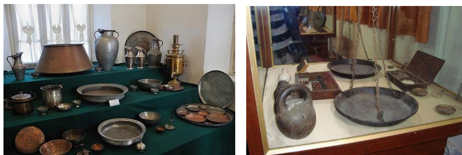
شکل 3. موزه تاریخی ارومیه

موزه ارومیه در خیابان شهید بهشتی شهر ارومیه قرار دارد و با توجه به غنای اشیای تاریخی نگهداری شده در آن، دومین گنجینه بزرگ تاریخی کشور به شمار می‌رود. این موزه در سال ۱۳۴۶ خورشیدی، با زیر بنای ۷۵۰ متر مربع در محوطه‌ای به وسعت ۲۰۰۰ متر مربع احداث شد و بعدها به منظور حفظ و نگهداری آثار و اشیای منحصر به فرد و در راستای گسترش موزه، دو فضای نسبتاً بزرگ و یک گنجینه زیرزمینی به آن افزوده شد.