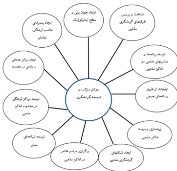
شکل 1. عوامل مؤثر بر توسعه گردشگری

عوامل متعددی در توسعه گردشگری نقش دارند که اهم آنان عبارتند از: 1. ارتقاء جهان بینی و سطح ایدئولوژیک، 2. ایجاد بسترهای مناسب فرهنگی، زیارتی، 3. شناخت و بررسی ظرفیت‌های گردشگری، 4. توسعه برنامه‌ها و مناسبت‌ها، 5. تبلیغات از طریق رسانه‌های جمعی، 6. زیباسازی و مرمت اماکن، 7. برگزاری مراسم خاص، 8. ایجاد تشکلهای گردشگری، 9. توسعه شبکه‌های معابر و تسهیل دسترسی، 10. توسعه مراکز فرهنگی، 11. ایجاد مراکز خدماتی و رفاهی در محدوده (Azimi & Jamdar, 2016: 11)