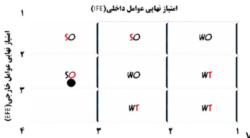
شکل 4. ماتریس ارزیابی عوامل داخلی و خارجی بافت تاریخی فرسوده شهر ارومیه

به همین شیوه، جمع امتیاز نهایی عوامل خارجی بر روی محور Yها از 1 تا 1.99 ضعف سیستم را نشان می‌دهد، امتیازهای 2 تا 2.99 بیانگر قراردادن سیستم در وضعیت متوسط و سرانجام امتیازهای 3 تا 4 نشان از قراردادن سیستم در وضع عالی دارند.