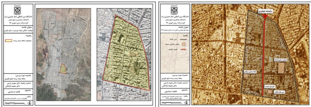
نقشه شماره (۱) و (۲): موقعیت مکانی محدوده مورد بررسی در شهر قزوین و پهنه‌های فعالیتی و کانون‌ها در عکس هوایی سال ۱۳۷۳

در تحقیق حاضر، مطالعات بر روی محله‌ی پنبه‌ریسه، یکی از کهن‌ترین محلات شهر قزوین، به عنوان نمونه موردی، صورت گرفته‌است. این محله زیرمجموعه‌ای از مجموعه بزرگ شهری قزوین، یکی از شهرهای قدیمی و کهن ایران، مرکز استان قزوین و شهرستان قزوین است که بر اساس تقسیمات شهری در منطقه یک این شهر قرار دارد و نام آن در کتیبه گچ‌بری کوفی مسجد جامع عتیق قزوین نیز آمده است. به لحاظ بافت تاریخی و منظر اجتماعی غنی و واجد ارزش است که اقامت و سکونت مردم قزوین با قدمتی بیش از ۱۰۰۰ سال را در این محله نشان می‌دهد. این محله از شرق به بلوار مدرس، از شمال به خیابان عدل، از جنوب به خیابان طالقانی و از غرب به خیابان فردوسی ختم می‌شود و شامل عناصر شاخصی از قبیل؛ کلیسای آرامنه (کانتور)، عمارت شهرداری، زورخانه باهنر، خانه حسین بهشتی است که از گذشته باقی مانده و در حال حاضر نیز از اجزای ارزشمند موجود در بافت محله محسوب می‌شود.