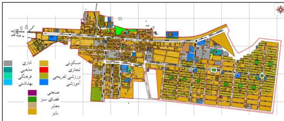
نقشه شماره ۲. کاربری اراضی در شهر حاجی آباد

بر اساس آمار ارائه شده کاربری مسکونی ۲۰,۶ درصد از اراضی شهر را در برگرفته است و وسعت آن در حدود ۲۲۶,۸ هکتار است. کاربری تجاری حدود ۲,۲۵ هکتار از اراضی شهر را به خود اختصاص داده است که برابر ۰,۷۷ درصد از کل اراضی شهر می شود. کاربری آموزشی (کودکستان، دبستان، راهنمایی، دبیرستان، فنی-حرفه‌ای، پیش‌دانشگاهی، سایر آموزشی) دارای سطوحی معادل ۶,۲۱ هکتار در شهر است که سرانه آن برابر ۳,۱۳ مترمربع برای هر یک از شهروندان می شود. سطح کاربری فرهنگی-مذهبی در شهر ۴,۱۴ هکتار است. کاربری پارک و فضای سبز در مجموع حدود ۲,۹۳ هکتار از اراضی شهر را اشغال کرده است که برابر ۱ درصد از اراضی شهری می شود و سرانه آن در وضع موجود شهر معادل ۴,۸۵ مترمربع برای هر شهروند است.