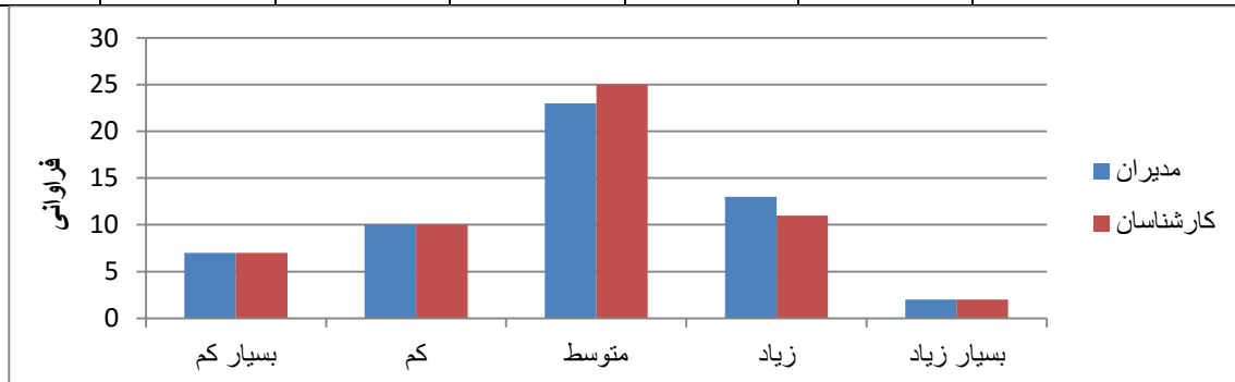
نمودار ۲- میزان تأثیر استفاده از اوراق قابل معاوضه با سهام در بهبود منابع مالی طرح‌های توسعه شهری

بر اساس جدول ۴، ۳۸/۱۸ درصد از مدیران و ۴۷/۲۷ درصد از کارشناسان میزان تأثیر استفاده از اوراق مشارکت شهری در بهبود منابع مالی طرح‌های توسعه شهری را در حد بسیار زیاد مورد تاکید قرار داده‌اند که این نتایج در نمودار ۳، نیز به نمایش آورده شده است.