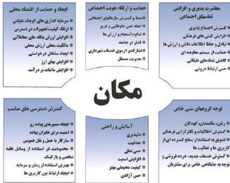
شکل (۳) معیارهای افزایش کیفیت در فضای عمومی شهری