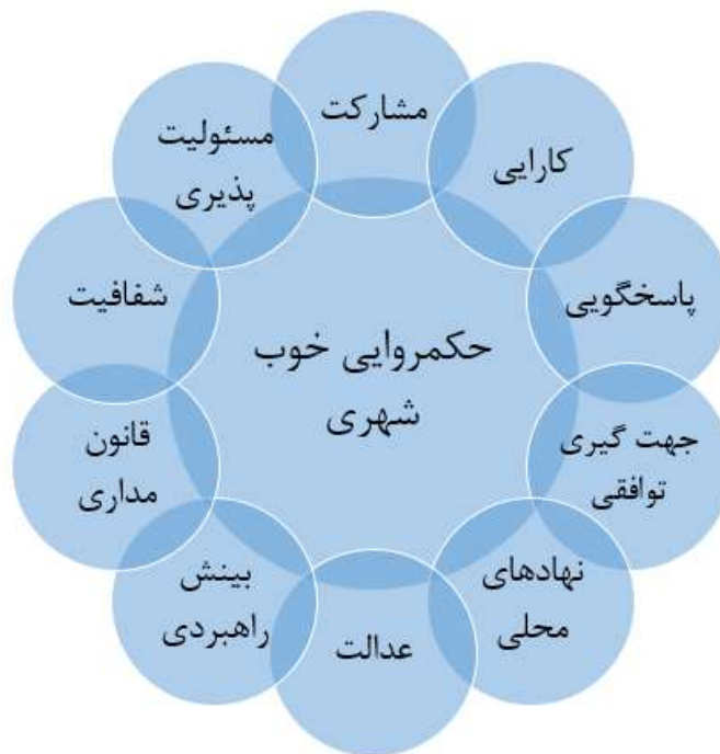
شکل ۱. شاخص های حکمروایی خوب شهری