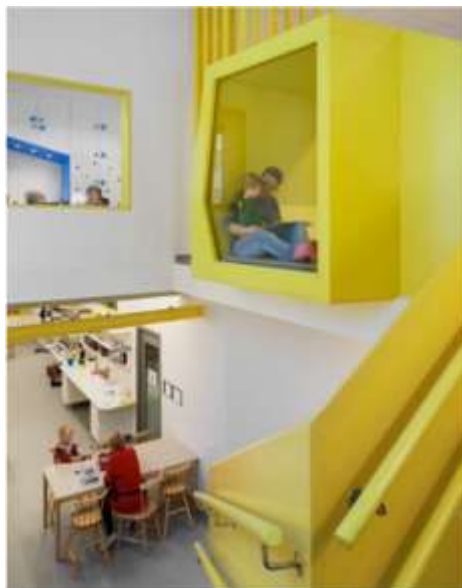
تصویر ۱: فضای داخلی مهد کودک Sjötorget

می شود. برای کسب اطلاعات و تنظیم و تدوین سیستم تعلیم و تربیت در مکان های آموزشی. معمولاً انتخاب رنگ توسط کودک می تواند اطلاعات نسبتاً صحیحی را به راهنما یا مربی کودک در زمینه رفتارهای خانوادگی و نوع عملکرد خانواده ها در منزل بدهد (جنت خواه، ۱۳۹۱: ۱۲). کودکانی که از رنگ های تیره در نقاشی هایشان استفاده می کنند معمولاً در خانه از آرامش کافی برخوردار نیستند و غالباً پس از بررسی از مشاجرات پدر و مادر و یا بداخلاقی والدین گله می کنند. سرخوردگی های کودک که ناشی از تربیت سوء والدین می باشد مستقیماً در انتخاب رنگ ها تأثیر می گذارد. همچنین وقایع مهم اجتماعی نظیر اعیاد جشن ها و عزاداری ها، ایجاد جو غالب روحی به کودک کاملاً در نقاشی های او نمودار می شود (حاجی پور و همکاران، ۱۳۹۲)؛ اما به دور از تأثیرات بیرونی عوامل ذاتی کودک در برخورد با رنگ ها و انتخاب آن ها می تواند شناخت کامل و دقیقی به مربی نسبت به وضعیت روحی و رون پرورش کودک بدهد. از سوی دیگر رنگ در ایجاد التهاب و آرامش در کودک بیش از افراد بالغ تأثیرگذار بوده و طبیعتاً در شخصیت پردازی وی مؤثر است. گاه تأثیرات به جامانده از نحوه برخورد با رنگ در زمان کودکی تا پایان عمر به جا می ماند (مطلق زاده، ۱۳۸۷: ۱۲).