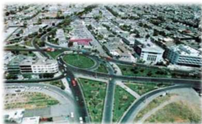
شکل شماره (۳) : میدان آزادی کرمانشاه

زبان اهالی کرمانشاه کردی است، زبان کردی خویشاوند نسبی زبان فارسی است زیرا اشتراک قواعد دستوری و ذخیره لغوی زبان های ایرانی نتیجه خویشاوندی نسبی آنها است. زبان کردی که شاخه ای از زبان شمال غربی ایرانی میانه است به علت