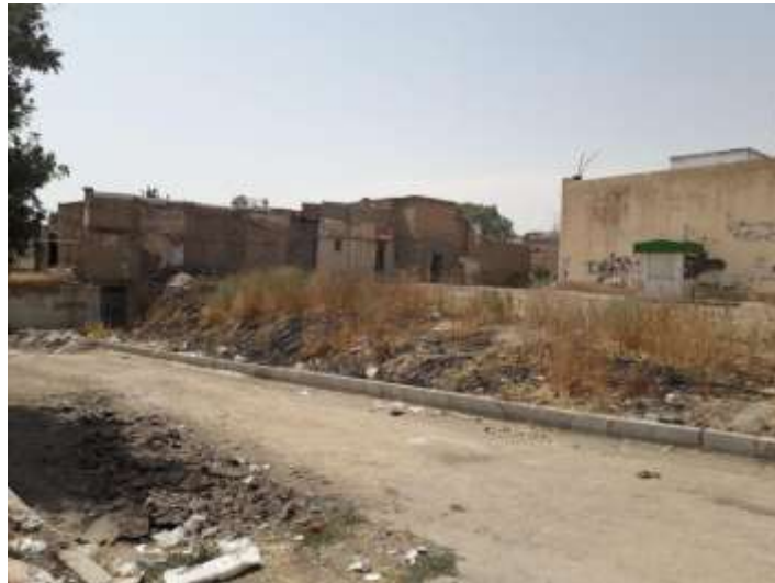
شکل شماره (۴): اطراف سایت

- استفاده از درختان همیشه سبزی مانند سرو و کاج در محوطه و در امتداد عمود بر مسیر باد زمستانی می تواند از فشار باد بر ساختمان کم کرده از اتلاف گرمای ساختمان در زمستان جلوگیری کند.