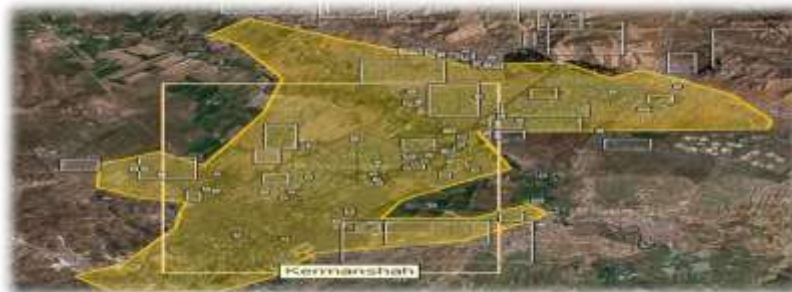
شکل شماره (۲) : نقشه جغرافیایی شهر کرمانشاه

آب و هوای کرمانشاه معتدل کوهستانی است. صرف نظر از مناطقی که در مرز غربی قرار گرفته اند بقیه مناطق استان تحت تأثیر ارتفاعات این استان و جریان مرطوب مدیترانه ای قرار گرفته دارای رطوبت بیشتر و دامنه های رو به مشرق خشک تر و دارای نزولات جوی کمتری می باشد.