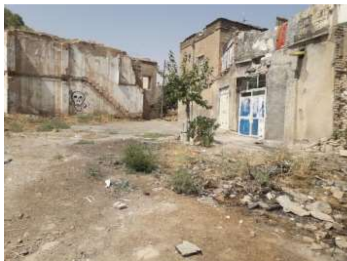
شکل شماره (۵): اطراف سایت