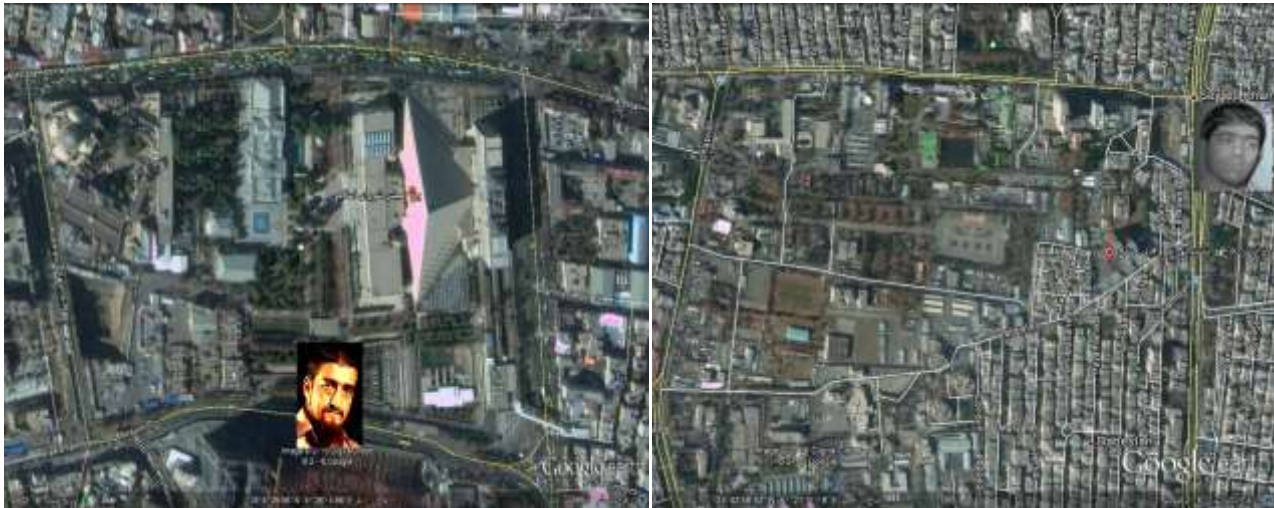
شکل ۲. اماکن حساس و تهدیدهای تروریستی (وزارت دفاع و ساختمان مجلس)

داده‌های ورودی به سامانه نیز از محل چهره‌زنی گشت پلیس، اطلاعات جاسوسی انسانی و نیروهای امنیتی، اطلاعات موجود و ورودی به پایگاه داده، اطلاعات دوربین‌های راهنمایی و رانندگی، دوربین‌های مداربسته و ... تأمین می‌شود (شکل ۲) داده‌های دریافتی از حسگرهای موجود در اطراف این موقعیت داده‌هایی با قالب‌های متفاوت را به بستر سامانه می‌زبان فرآیند اطلاعات که از ویژگی IOT بهره می‌برد ارسال می‌کنند.