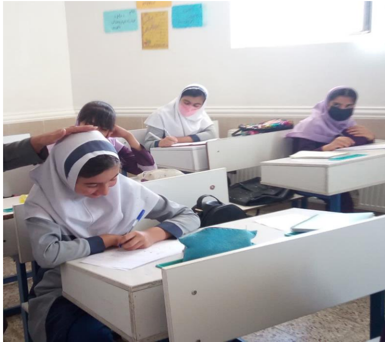
تصویر ۴ : تشویق دانش آموز توسط آموزگار