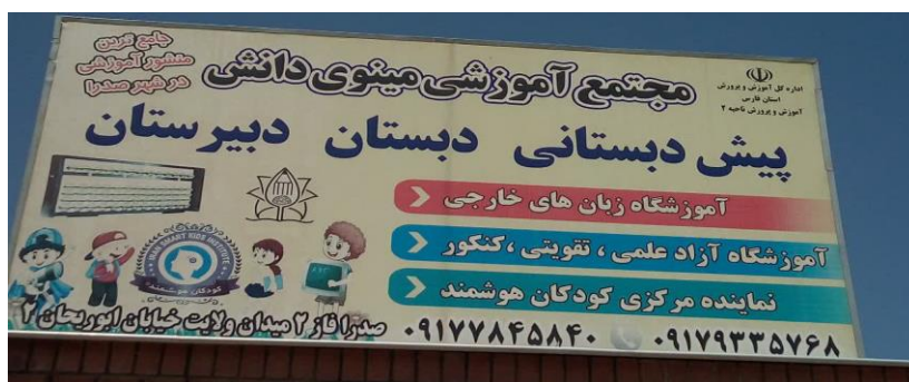
تصویر ۲ : سر درب ورودی پیش دبستانی مینوی دانش

می برد . تشویق باید بلافاصله و بعد از عمل انجام گیرد . تشویق باید تایید کننده عمل دانش آموز باشد نه وجود و شخصیت او، زیرا کودک یا نوجوان فکر می کند اگر آن خصوصیت ویژگی را نداشته باشد دیگر مورد ارزش و احترام نیست . رفتارهای شایسته و مطلوب دانش آموزان را همواره مد نظر داشته باشید چرا که رفتارهای آینده آنان را به شدت تحت تاثیر قرار می دهد . تشویق احساسی ، با ارزش بودن را در دانش آموز به وجود خواهد آورد و اعتقاد و باور کودک را نسبت به خودش تقویت می کند . تشویق از مهم ترین انگیزه های پیشبرد تعلیم و تربیت به شمار می رود و منظور از پاداش و تشویق ، هر عملی که در تثبیت تمایلات و نیل به آمال انسان موثر باشد .