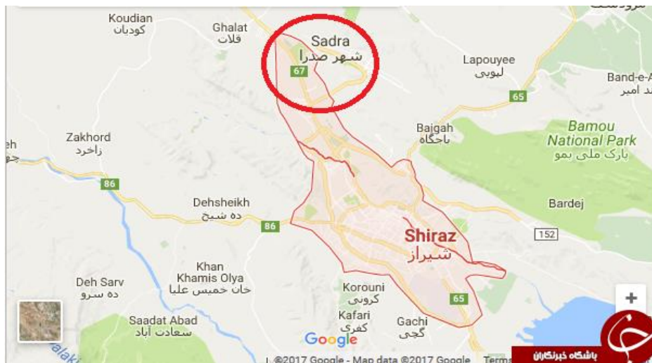
تصویر ۱: موقعیت شهر صدرا در کنار شیراز