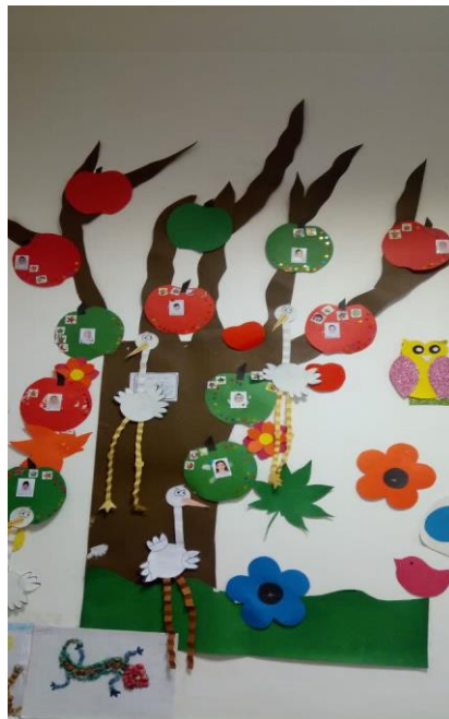
تصویر ۵ : نمونه تشویق دانش آموزان در تابلوی اعلانات مدرسه