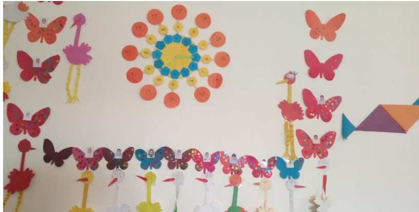
تصویر ۶: نمونه تشویق دانش آموزان