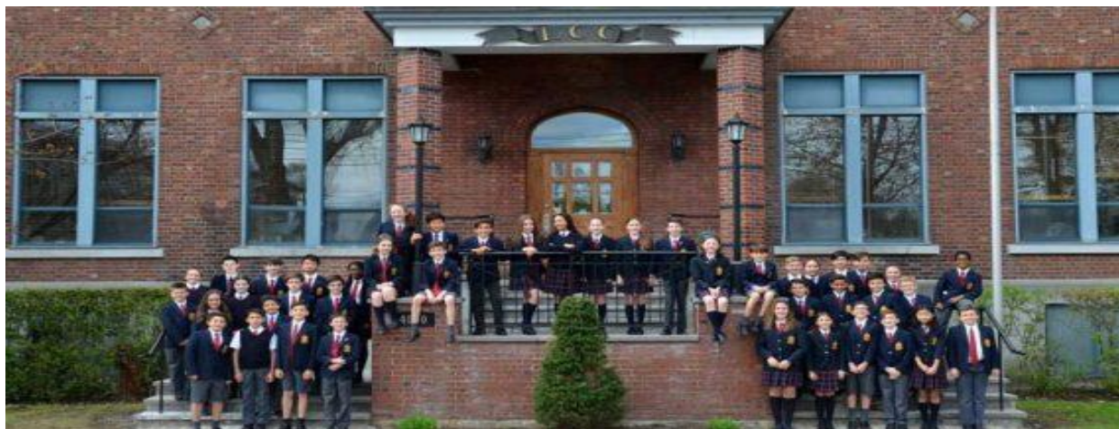
تصویر یک مدرسه شبانه روزی در کانادا

کشور کانادا دارای سیستم آموزشی بسیار قدرتمند و منسجم است که معمولاً به شیوه ی ایالتی و یا استانی اداره می شود. اگرچه معمولاً روش ها و متدهای آموزشی ایالت های کانادا با هم فرق دارد، اما نهایتاً سیستم آموزشی کانادا در اختیار دولت فدرال است و به همین علت معمولاً یکپارچگی و انسجام خاصی در آن دیده می شود. معمولاً در سیستم آموزشی کشور کانادا، هم آموزش دولتی وجود دارد و هم آموزش خصوصی. دولت فدرال کانادا به بحث آموزش و پرورش کودکان و نوجوانان، توجه ویژه ای دارد و از سطح پایه اول (پیش دبستانی) تا سطح عالی (دانشگاه) را تحت پوشش خود و حمایت دولت قرار داده است. دولت کانادا، چیزی حدود ۷ درصد از تولیدات ناخالص داخلی اش را به نظام آموزشی اختصاص داده است که این درصد بسیار چشمگیر است. سیستم آموزشی کانادا که یک کشور به شدت توسعه یافته است یکی از باکیفیت ترین دستگاه های آموزشی در جهان محسوب می شود. تحصیل در کانادا تا حد زیادی دولتی است و توسط ادارات حکومتی استانی، منطقه ای و محلی تأمین مالی و نظارت می شوند. تحصیل در کانادا تا سن ۱۶ سالگی اجباری است. کشور کانادا در کل ۱۹۰ روز تحصیلی (در کبک ۱۸۰ روز تحصیلی) در طول سال دارد. دوره های تحصیلی در سیستم آموزشی کانادا شامل پیش-دبستانی، ابتدایی، راهنمایی، دبیرستان ابتدایی و دبیرستان می شود.