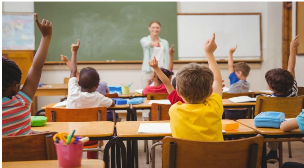
تصویری از یک مدرسه ابتدایی در تورنتو کانادا