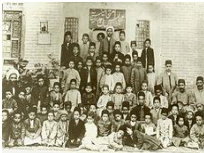
❖ شاگردان مدرسه‌ای در ارومیه، سال ۱۳۲۸ شمسی