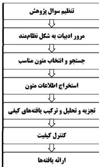
شکل ۱: گام‌های متوالی روش فراترکیب (Sandelowski and Barroso, ۲۰۰۷)

بر اساس این روش، مراحل مبسوط پیاده‌سازی روش فراترکیب به شرح زیر می‌باشد: