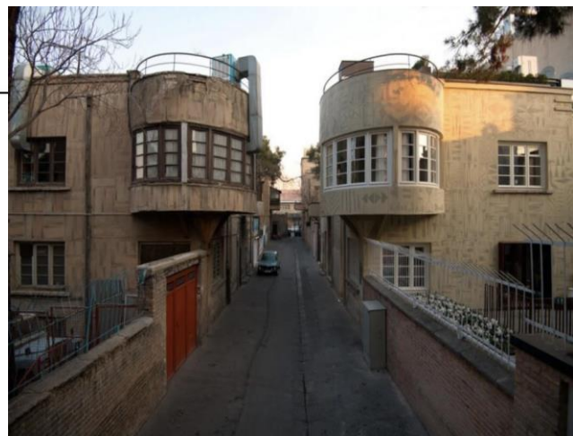
شکل شماره (۱): موقعیت سایت کوچه لولاگر واقع در خیابان نوفل لوشاتو تهران