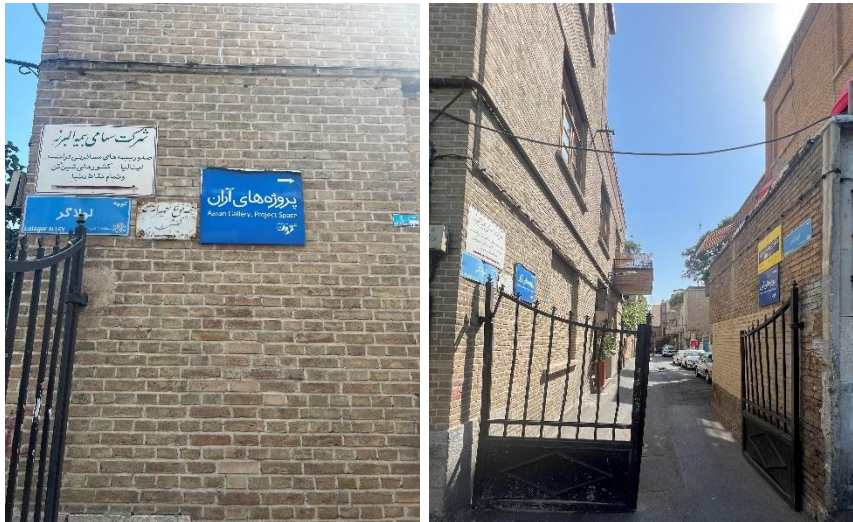
شکل شماره (۳): ورودی کوچه لولاگر