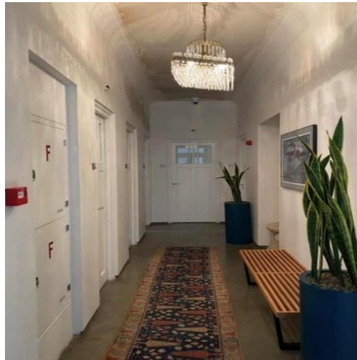
شکل شماره (۱۷): راهرو همکف فضای اقامتی