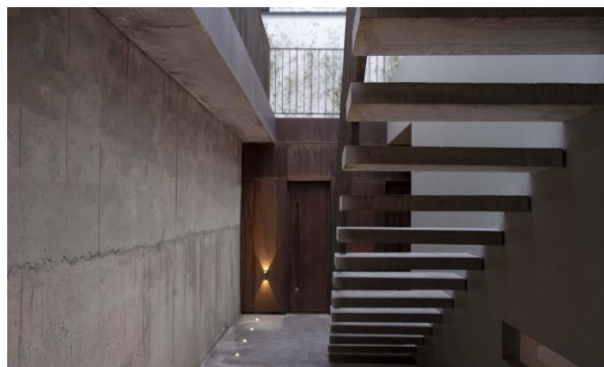
شکل شماره (۲۵): راه پله ورودی

در کنار حوضچه ردیفی از پلکان قرار دارد که به قسمت زیر زمین که الحاقی است دسترسی را میسر میکند. کف و پلکان زیرزمین از جنس بتن بوده است. دیوار روبرویی پلکان با مصالح متفاوت از جنس فلز که ظاهری زنگ زده و قدیمی دارد بوده و بر روی آن یک نور دکوراتیو فراتاب/فروتاب قرار گرفته است و همچنین در زیر ردیف پله یک باغچه مستطیلی کشیده قرار دارد و روی دیوار مجاور این باغچه یک پنجره مستطیلی کشیده با اوکابه کوتاه قرار گرفته است. در کنار دیوار زیرزمین نورپردازی نقطه‌ای وجود دارد. استفاده از پله برای نشان دادن وضعیت مدرن و استفاده از مصالح فلز که نماد مدرنیته است انتخاب بسیار مناسبی است. همچنین ظاهر قدیمی فلز یادآور حس کهنگی و قدیمی است. این بار نیز طراح به خوبی توانسته است تلفیق سنت و مدرنیته را نشان دهد. نورهای نقطه‌ای که در کف به صورت یک ردیف قرار دارند، هدایت کننده مسیر هستند.