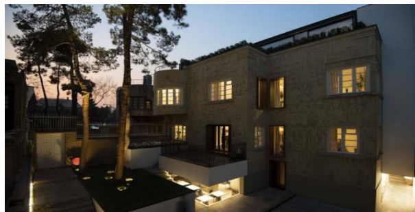
شکل شماره (۲۲): نمای بوتیک هتل حنا در شب

در جای جای حیاط نورپردازی‌های مختلف با دمای گرم دیده می‌شود. نورهای خطی روی زمین و در کنار دیواره‌ها و نورهای نقطه ای در باغچه‌ها نیز به چشم می‌خورد. نورهای خطی جهت خوانایی و تاکید مسیر استفاده شده و دلیل استفاده از نور گرم ایجاد فضایی صمیمانه است. همچنین چراغ‌های فراتاب که در پای درختان قرار دارد قدمت درختان را به خوبی تاکید میکند. در زیر تراس الحاقی که به شکل مکعب سفید است، از مصالح شیشه استفاده شده که فضای داخلی زیرین آن کامل نمایان است و دور تا دور آن را نورهای خطی تشکیل داده و باعث شفافیت بیشتر، ایجاد حس معلق بودن و نیز تاکید بر مسیر پله دارد. در انتهای حیاط نورپردازی دعوت کننده‌ای جهت ورود به گالری به چشم می‌آید.