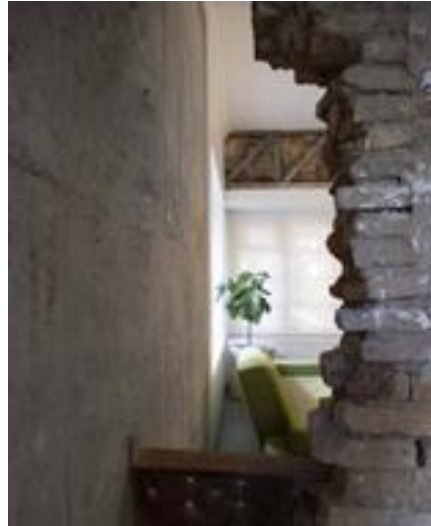
شکل شماره (۲۶): قسمت های آجری آسیب دیده بازسازی نشده