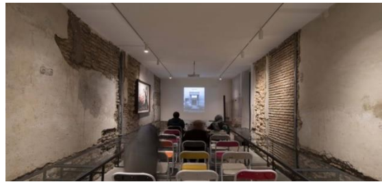
شکل شماره (۱۹): پلتفرم

پلتفرم در زیرزمین بوتیک هتل حنا قرار دارد. این فضا با ظرفیت ۳۵ نفر، امکان برگزاری رویدادها و دیدارهای مختلف را دارد. پلتفرم بوتیک هتل حنا طراحی ای متفاوت و ویژه دارد. در فرایند بازسازی بوتیک هتل حنا، یک آب انبار قدیمی کشف شد که سال ها کسی از وجود آن اطلاعی نداشت. این فضا به پلتفرم بوتیک هتل حنا متصل است و امکان فعالیت های جانبی در کنار رویدادهای در حال برگزاری در محل پلتفرم را فراهم خواهد کرد. در قسمتی از فضا شاهد سالنی برای نمایش فیلم هستیم که صندلی های آن قابلیت جابه جایی دارند و در دو طرف سالن میزهای شیشه ای قرار گرفته است. نورپردازی این فضا توسط نورهای اسپات ریلی تامین می شود.