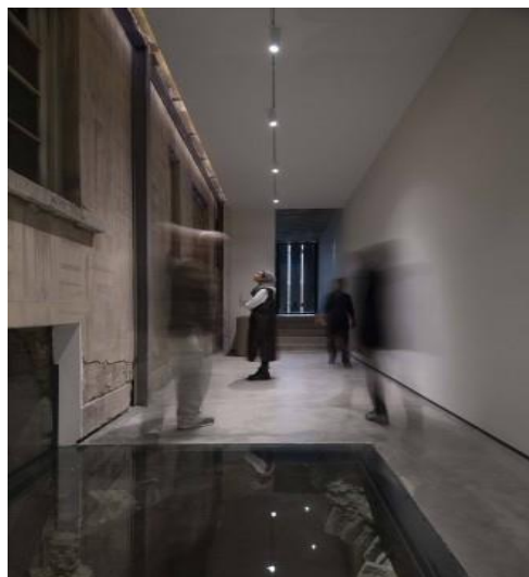
شکل شماره (۲۳): پاپ آپ بوتیک هتل حنا

سالن چند منظوره بام بوتیک هتل حنا که مانند پاپ آپ یک فضای الحاقی است، به شکل بام سبز و دارای یک فضای الحاقی است فضایی مجهز برای برگزاری رویدادها و جلسات است. این سالن که از جدیدترین لایه‌های ساختمان کوچه لولاگر است، نماد روح مدرن و کاربرد امروزی این مجموعه است که طراح توانسته این نماد را با وجود عناصری همچون دیوارهای شیشه‌ای و شکاف نور بر روی دیوار و سقف به خوبی نشان دهد. وجود فضای سبز بر روی بام خانه، پنجره‌های سرتاسری، فضای اختصاصی و معماری مدرن، این فضا را به مکانی متفاوت برای رویدادها و دیدارها تبدیل می‌کند. دیوارها از جنس شیشه و قاب فلزی با