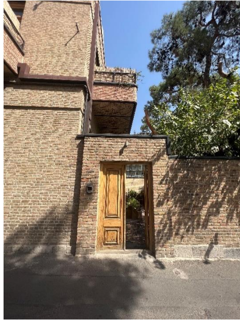
شکل شماره (۵): ورودی گالری (پروژه‌های آران)

کافه لولاگر یک کافه زیبا، متفاوت و جذاب برای کسانی است که به هنر و گالری‌گردی علاقه‌مند هستند. محیط گرم و برای تعداد زیادی گردشگر است، فضایی روشن با پنجره‌های بزرگی که به حیاط باز می‌شوند. معماری و طراحی فضای داخلی این کافه به گونه‌ای است که در بدو ورود، تفاوت آن با دیگر کافه‌ها حس می‌شود و وجود پنجره‌های بزرگ رو به حیاط و فضای پر نور کافه، آرامشی ویژه به بازدیدکنندگان ارائه می‌دهد. در طراحی مرمتی این بنا سعی شده تا در پوسته خارجی رویکردی حفاظتی در پیش گرفته شود و در بخش‌های داخلی با بیانی مدرن ضمن حفظ ساختار کلی فضا نقاط ضعف سازه‌ای و تاسیساتی بنا برطرف شود. نورپردازی یکی از مهم‌ترین ارکان طراحی است و جای آن در این مکان هم خالی نیست و زیبایی‌های بسیاری به بنا داده است توجه به پنجره‌ها که با نورهای طبیعی جای جای این بنا را غرق نور کرده است دیدنی است. می‌توان گفت در تغییر کاربری کافه لولاگر از روش قابل توجهی استفاده شده است که جذابیت فضاهای داخلی را دوچندان کرده است، هنگامی که قدم‌های اولیه خود را به داخل کافه می‌گذاریم متوجه قسمت‌های از دیوار آجری بنا می‌شویم. در این قسمت‌ها شاهد بافت آجری شکل قدیمی ساختمان هستیم. با وارد شدن به این مکان متوجه قدمت این ساختمان و تغییر کاربری این بنا از یک ساختمان مسکونی به یک کافه، گالری هستیم و تصمیم بر آن بوده است که کاربران آینده این ساختمان را از توجه و آگاهی از قدمت این ساختمان دور نکند بلکه اصالت و شخصیت اصلی ساختمان را به رخ بکشد.