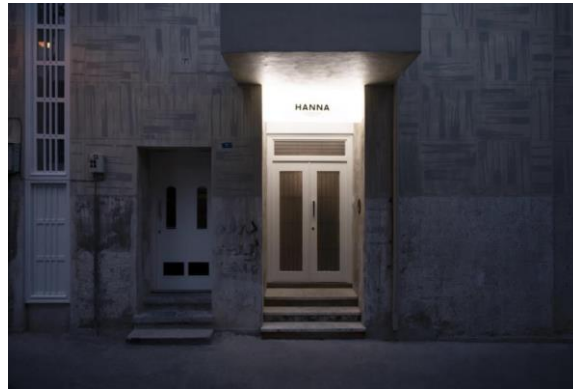
شکل شماره (۱۴): درب ورودی بوتیک هتل حنا

ورودی مجموعه در تضاد با ورودی گالری الحاقی در کنار آن است که مصالح آن شیشه‌ای و شفاف بوده و درون گالری از بیرون کامل نمایان است. در شیشه‌ای با فلز قهوه‌ای رنگ صیقل نخورده قاب شده است که باعث ایجاد تضاد رنگی و تیره و روشنی با در ورودی اصلی شده است. دو درب سفید رنگ دیگر در نمای ساختمان دیده می‌شود که بسته بوده و قابل تردد نیستند که یکی از آن‌ها در حیاط مجموعه است. معمار با به وجود آوردن این تضاد در بخش الحاقی، بر ارزش و قدمت بنای قدیمی افزوده است که راهکار مناسبی است.