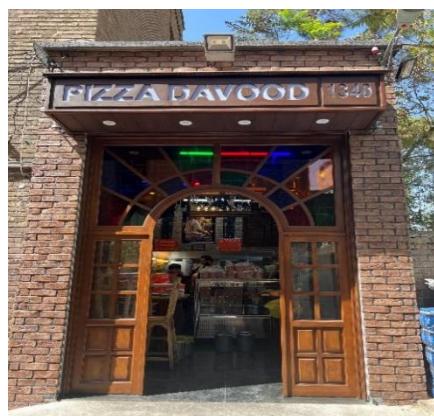
شکل شماره (۴): پیتزا فروشی داوود