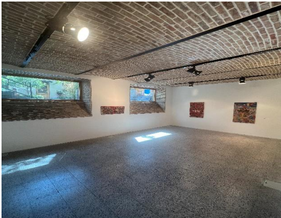
شکل شماره (۱۰): فضای گالری پروژه آران