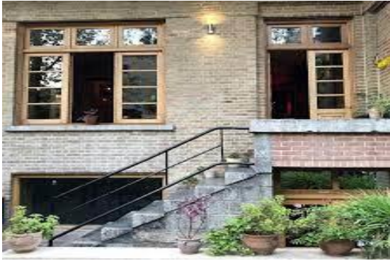
شکل شماره (۸): حیاط کافه لولاگر (رو به نمای کافه و گالری)