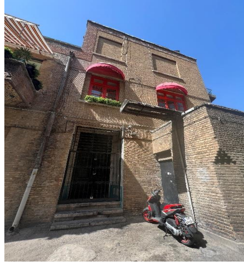
شکل شماره (۱۱): ساختمان قرینه، مقابل کافه لولاگر شکل شماره (۱۲): درب ورودی اصلی کافه گودو از خیابان اصلی

نمای ساختمان یک نمای آجر سه سانتی است. در و پنجره‌های این بنا در بازسازی با رنگ قرمز پرداخت شده‌اند که جذابیت زیادی به نما داده است. نما به دلیل حفظ کردن هویت اصلی بنا، در تعامل بودن با نمای ساختمان رو به رو و حفظ قرینگی کوچه لولاگر بسیار مناسب است. تاکید بر قدمت بنا ضرورت سبکی و تاریخی بودن عناصر جدید فضا را به همراه دارد. طراح این تواضع تاریخی را در قالب رنگ‌های خنثی و بدون بافت در مقابل بافت خشن و قدرتمند آجر و گچ‌کاری‌های پرداخت نشده در دید مخاطب نمایان می‌سازد. و تاکید بر ارزش اشکال و عناصر اصیل ایرانی را به خوبی نشان داده است. و توجه به پنجره‌ها که با نورهای طبیعی جای جای این بنا را غرق نور کرده است دیدنی کرده است. تلاش می‌کند تا مردم را به مرکز تهران بازگرداند و آن‌ها را با ساختمان‌های متروکه مجدداً آشنا سازد. و به ساختمان کمک می‌کند تا در حال حاضر و در آینده کاربران را در خود جای دهد و در عین حال جلوه‌ای از معماری تاریخی آن را نیز به نمایش بگذارد.