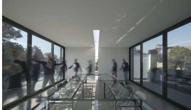
شکل شماره (۲۴): سالن چند منظوره بام بوتیک هتل حنا

پروفیل‌های به رنگ مشکی هستند که مصالح این پروفیل‌ها در ورودی گالری نیز تکرار شده است. هدف طراح از تکرار این مصالح عدم تنوع بیش از حد مصالح و ایجاد اغتشاش بصری بوده است.