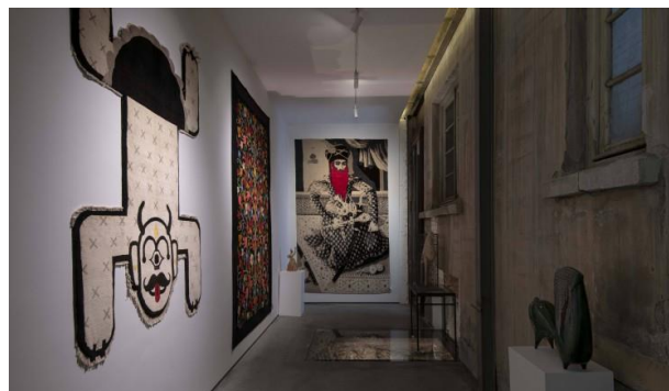
شکل شماره (۲۰): گالری

در این بنا گالری وجود دارد که جزو قسمت های الحاقی بنا است و دارای اختلاف سطح و سقف شیب دار می باشد که در قسمت ورودی گالری شاهد دو متریل متفاوت، متریل آجری که متریل اصلی ساختمان قدیمی و متریل جدید است. نورپردازی گالری به شکل نورهای خطی مخفی و همچنین نور های اسپات برای نمایش آثار در گالری که در مرکز فضا قرار دارند می باشد. روی دیوار سمت راست ورودی که دیوار قدیمی ساختمان اصلی است شاهد پنجره هایی از باقیمانده ساختمان اصلی است. تمام متریل های الحاقی مدرن و قالب شیشه می باشد مانند درب های ورودی جدید و بازسازی کف تخریب شده است.