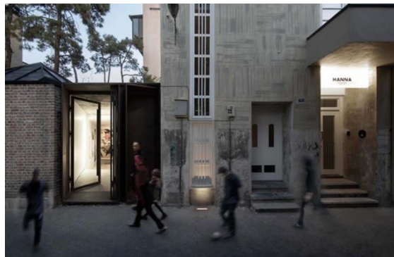
شکل شماره (۱۵): نمایی از بوتیک هتل حنا

ورودی مجموعه در تضاد با ورودی گالری الحاقی در کنار آن است که مصالح آن شیشه‌ای و شفاف بوده و درون گالری از بیرون کامل نمایان است. در شیشه‌ای با فلز قهوه‌ای رنگ صیقل نخورده قاب شده است که باعث ایجاد تضاد رنگی و تیره و روشنی با در ورودی اصلی شده است. دو درب سفید رنگ دیگر در نمای ساختمان دیده می‌شود که بسته بوده و قابل تردد نیستند که یکی از آن‌ها در حیاط مجموعه است. معمار با به وجود آوردن این تضاد در بخش الحاقی، بر ارزش و قدمت بنای قدیمی افزوده است که راهکار مناسبی است.