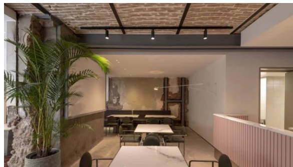
شکل شماره (۱۶): فضای رستوران بوتیک هتل حنا

یکی دیگر از ویژگی‌های برجسته فضاهای داخلی هتل حنا، تلاش برای حفظ کهنگی فضا است. طراح با نگاه داشتن بخش‌های تخریب‌شده و حفظ آسیب‌ها و تاریخ بنا، این فاکتورها را به فرصتی برای طراحی تبدیل کرده است. بعد از ورود به مجموعه بوتیک هتل حنا از درب اصلی سمت راست لابی و پذیرش قرار دارد که خود شامل دو اتاق است که توسط یک قوس بزرگ جدا شده‌اند. کنار میز پذیرش یک دست مبل برای نشستن و در قسمت مجاور یک میز بزرگ پذیرایی قرار گرفته است. در دیوار پشتی میز پذیرش سازه‌ی مستحکم شده‌ی الحاقی بنا پس از بازسازی به صورت نمایان قرار دارد. قسمتی از دیوار جداکننده دو فضای لابی نیز که قبلاً از بین رفته بود به صورت یک شکاف همچنان پا برجاست. پنجره‌های این فضا به سمت حیاط راه دارد و در مسیر خروج به سمت حیاط ابتدا وارد تراس‌های الحاقی جدید بنا خواهیم شد. مبلمان انتخابی در بوتیک هتل، مبلمانی مدرن بوده که در فضای سنتی هتل تلفیق زیبایی از سنت و مدرنیته ایجاد کرده است و با انتخاب رنگ و مصالح چوب هارمونی هوشمندانه‌ای در فضا ایجاد شده که بر ایجاد حس صمیمیت آن افزوده است. این هم نشینی مبلمان و تزئینات از هر دو سبک مدرن و سنتی در کنار یکدیگر همچنان تأکیدی بر تلفیق سنت و مدرنیته حاکم در فضا دارد تلاشی که میکوشد با خلق فضاهای مدرن و خوشایند رفاه فیزیکی، روحی و روانی کاربران خود را در اولویت قرار دهد.