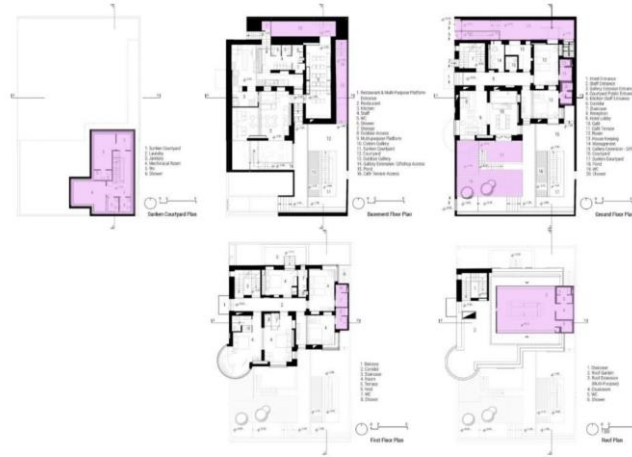
شکل شماره (۲۶): پلان بوتیک هتل حنا