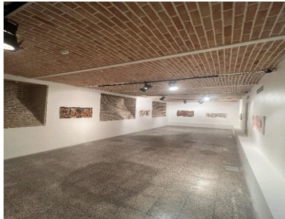
شکل شماره (۹): فضای گالری پروژه آران

با چنین رویکردی دو طبقه بالا عملکرد مسکونی اختصاص داده شده است و طبقه همکف به عملکرد کافه و طبقه زیرزمین به فضای نمایشگاهی تبدیل شده است.