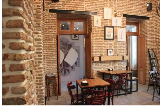
شکل شماره (۷): فضای داخل کافه لولاگر