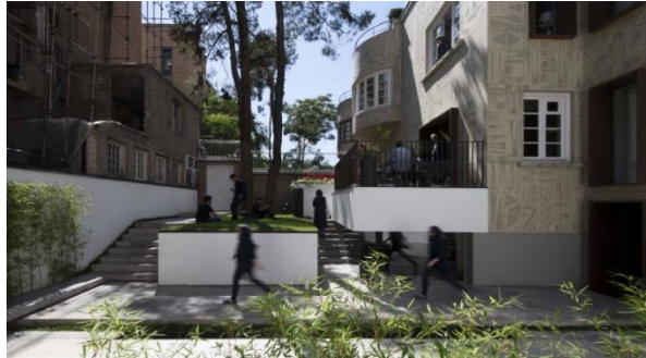
شکل شماره (۲۱): حیاط بوتیک هتل حنا

در بوتیک هتل حنا شاهد تعدادی مکعب سفید رنگ هستیم که در حیاط ایجاد اختلاف سطح می‌کنند و دارای عملکردهای متفاوت مانند تراس، باغچه و فضایی برای نشستن هستند و به وسیله پله به یکدیگر و دیگر فضاهای حیاط و ساختمان مرتبط می‌شوند. در نظر گرفتن رنگ متفاوت برای این تراس‌ها نشان از الحاقی بودن آن‌ها است و انتخاب رنگ سفید نشان از خلوص آن است و چون سفید یک رنگ خنثی است، در حیاط ایجاد اغتشاش بصری نکرده و هارمونی زیبایی را در کنار نمای ساختمان و دیگر عناصر حیاط ایجاد کرده است. این تراس‌ها به دلیل اختلاف سطحشان پاسخ مناسبی جهت ایجاد دید و چشم انداز در حیاط هستند.