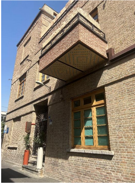
شکل شماره (۶): ورودی کافه لولاگر