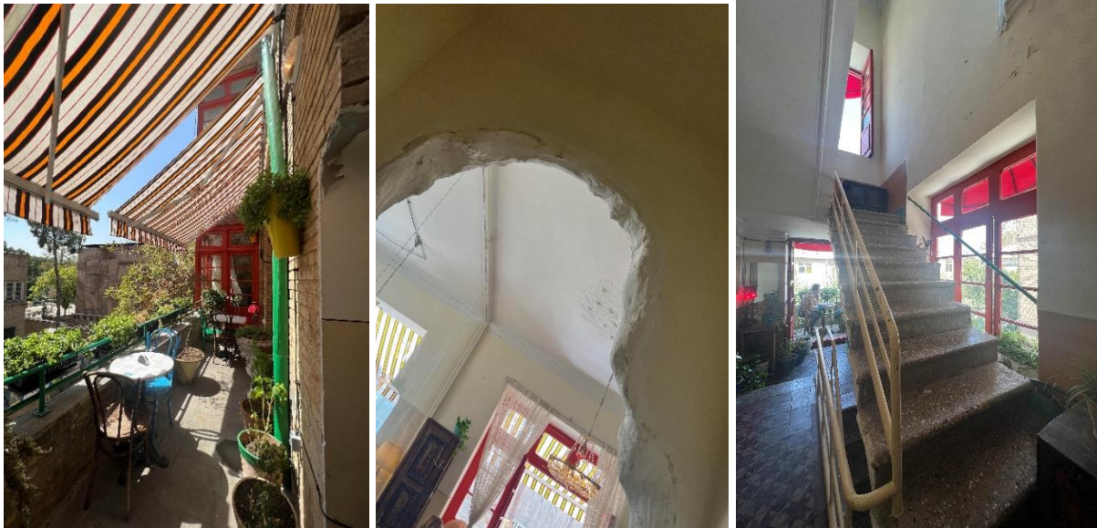
شکل شماره (۱۳): فضای داخلی کافه گودو

پروژه بوتیک هتل حنا توسط مهسا مجیدی و کوشش مجیدی، دفتر معماری باغ ایرانی، در سال ۱۳۹۷ بازسازی شده است. پروژه بوتیک هتل حنا در سال ۱۳۹۸ رتبه اول بخش بازسازی جایزه معمار را کسب کرده و در سال ۲۰۱۹ فینالیست بخش فرهنگی "قدیم و جدید" فستیوال جهانی معماری شده است.