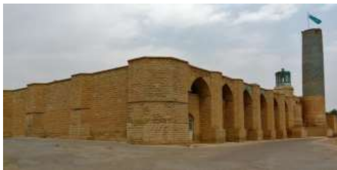
مرقد حاج شیخ جعفر شوشتری (ره)

آنچه هویدا است بزرگی و عزت مندی عالمان و فرهیختگان یک اقلیم است که سبب رشد و تعالی معنوی و روحی و فرهنگی یک شهرستان می شود. شوشتر به دلیل وجود عالمی ربانی و جلیل قدر از این موضوع عزت و سربلندی زیادی بر راستای موفقیتش می بیند.