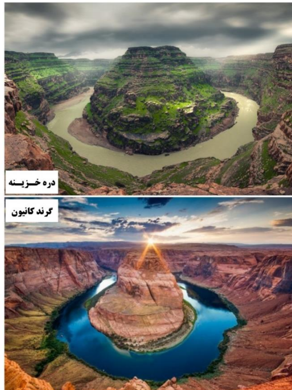
شکل ۲: شباهت دره خزینه ایران و گرد کانیون آمریکا