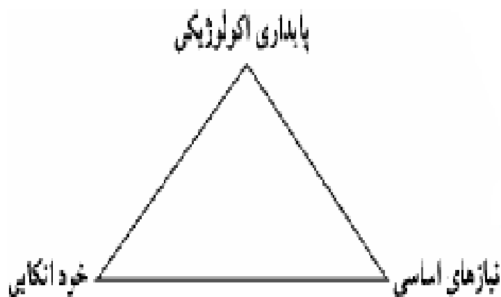
شکل ۲: رئوس مثلث توسعه پایدار

منظور از توسعه پایدار، حفاظت صرف از محیط زیست در نظر نیست، بلکه مفهوم جدیدی از رشد اقتصادی است که عدالت و امکانات زندگی را برای تمامی مردم جهان و نه تعداد اندکی از افراد برگزیده است. در این رهیافت جدید از توسعه، نوع استفاده از منابع طبیعی موضوع محیط زیست و توسعه اکولوژیکی، توسعه اکوسیستم اجتماعی همراه با تأمین نیازهای اساسی استراتژی جهانی حفاظت، مورد توجه می باشد. مایکل راد کلیفت سه ضلع مثلث آن را به صورت زیر نمایش می دهد (نقدی و صادقی، ۱۳۸۵).