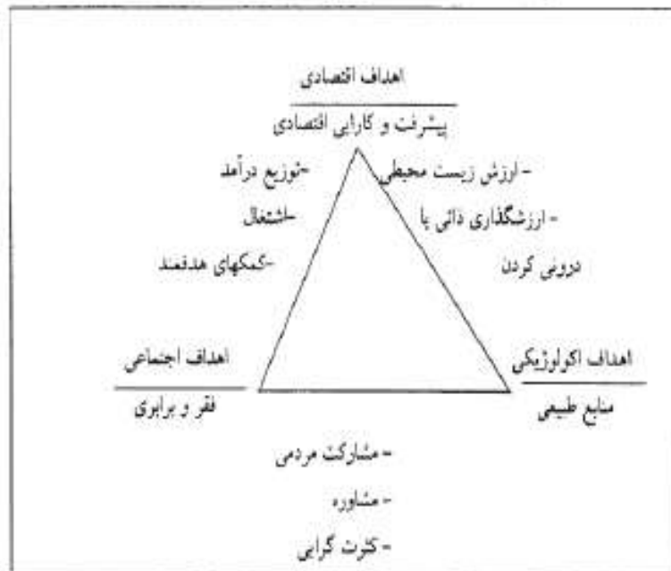
شکل ۳: اضلاع مثلث توسعه پایدار