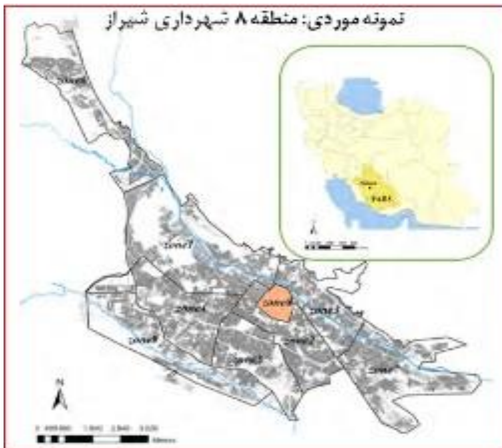
شکل ۱: موقعیت منطقه مورد مطالعه

شهر شیراز با وسعتی معادل ۱۹۳ کیلومتر مربع و جمعیتی بالغ بر ۱,۴ میلیون نفر پنجمین شهر پرجمعیت ایران محسوب می گردد و دارای ۱۰ منطقه با وسعت و جمعیت متفاوت می باشد (شکل (۱) (مهندسین مشاور شهرو خانه، ۱۳۹۹).