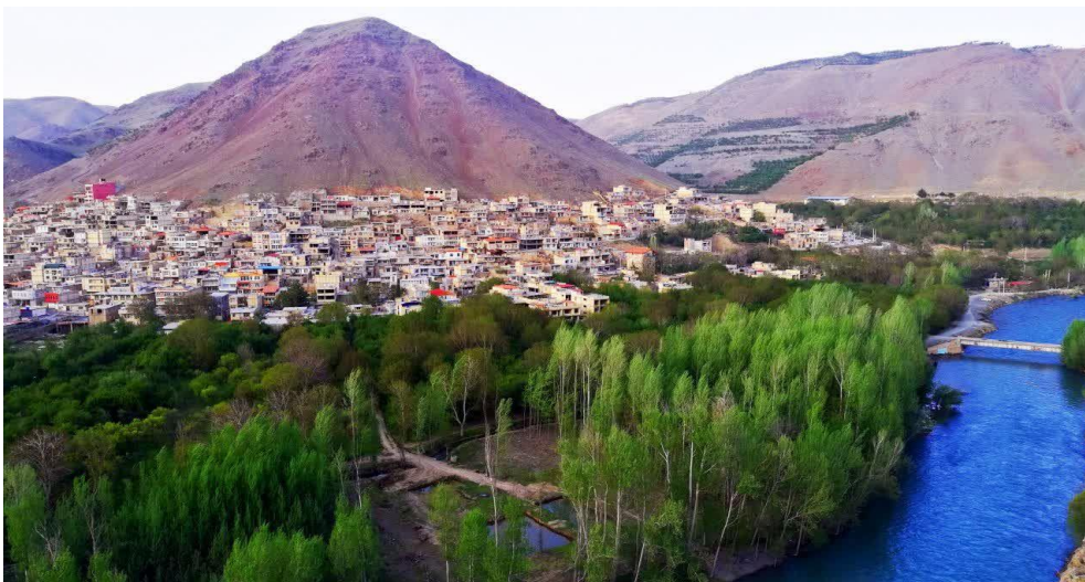
شکل ۳. تصویری از طبیعت روستای مارکده

روستای مارکده و روستای قوچان منطقه گردشگری بسیار زیبایی ایجاد کرده اند که زمینه توسعه گردشگری دارد. قرار گرفتن این روستاها در پایین یک کوه و کنار رودخانه زاینده رود و باغ های وسیع یک منطقه بسیار زیبا ایجاد کرده است (شکل ۲) و واسطه داشتن طبیعت سرسبز و وجود رودخانه پر آب زاینده رود، از زیباترین منطقه گردشگری استان چهارمحال و بختیاری به شمار می رود. همچنین وجود بناهای تاریخی در کنار جاذبه های طبیعی از ظرفیت های منطقه به شمار می رود که نقش مهمی در ورود مسافر و گردشگر دارد. یک حمام تاریخی در این روستا وجود دارد که با مرمت آن می توان در مسیر توسعه گردشگری روستا از آن بهره گرفت. در حال حاضر نیز گردشگران بسیاری در روزهای تعطیل به روستای مارکده سفر می کنند، بسیاری از اهالی روستای مارکده خانه های دو طبقه در روستا ساخته اند که یک واحد طبقه اول را خود ساکن هستند و واحد طبقه دوم را به گردشگران منطقه اجاره می دهند.