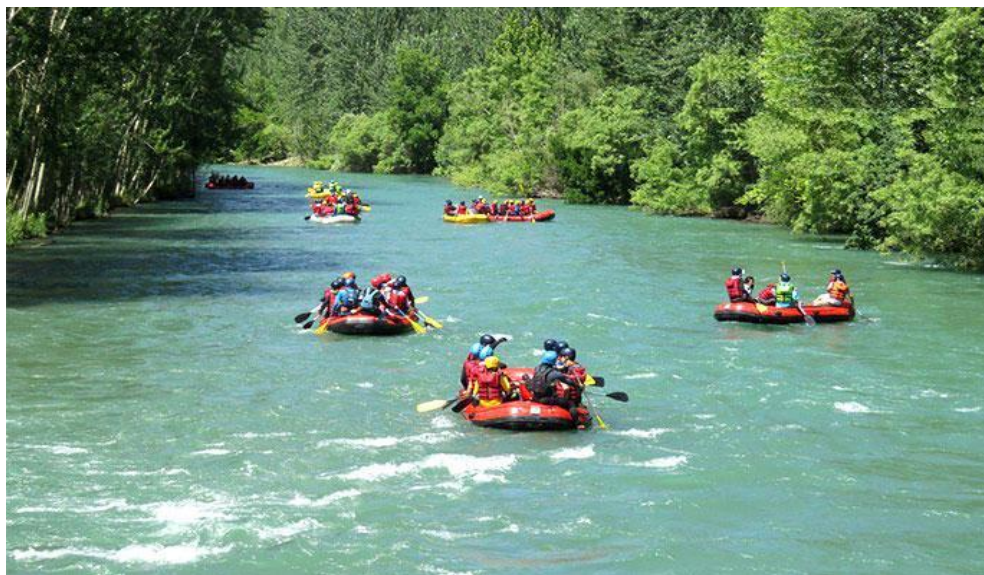
شکل ۴. انجام ورزش رفتینگ در رودخانه زاینده رود

علاوه بر رفتینگ، این منطقه برای دوچرخه سواری نیز مناسب است. همچنین یک حمام تاریخی هم در این روستای شگفت‌انگیز وجود دارد که می‌توان از آن دیدن کرد. دهکده امکانات رفاهی نسبتاً مناسبی هم برای مهمانان و مسافران دارد. چه هنگام عبور از این روستا بخواهند نیم روزی را در آنجا بگذرانند و چه بخواهند شب را در آن جا اقامت کنند، در بعضی از باغ‌های این روستا تخت‌هایی قرار داده شده است که با پرداخت هزینه اندکی می‌توان چند ساعتی را آن جا استراحت کرده و از طبیعت لذت برد. همچنین خانه‌های ویلایی، سوئیت‌ها و باغ‌هایی در آنجا وجود دارد که دارای محل استراحت و اسکان مهمانان است. با اجاره کردن این باغ‌ها می‌توان شبی به یادماندنی را در آن فضای روستایی تجربه کرد. همچنین می‌توان از آنجا چادرهایی کرایه کرده و کمپ خود را برپا کرد.