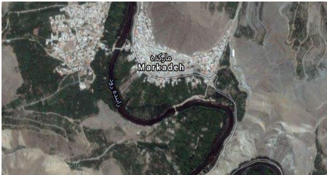
شکل ۲ تصویر هوایی از موقعیت روستای مارکده

روستای مارکده، که در دهستان هوره از توابع بخش سامان شهرستان شهرکرد واقع شده است، جمعیت روستای مارکده براساس سرشماری مرکز آمار ایران در سال ۱۳۹۷، جمعیت آن ۲,۰۰۰ نفر (۵۰۰ خانوار) بوده است. روستای مارکده یکی از روستاهای تاریخی شهرستان سامان استان چهارمحال و بختیاری است و در کنار رودخانه زاینده رود قرار گرفته است و یکی از پیچ و خم های دره و رودخانه زاینده رود قرار دارد. مارکده روبروی روستای قوچان واقع شده به گونه ای که عرض رودخانه فاصله بین دو روستا محسوب می شود. و با ساخت پل بر روی رودخانه، امروزه این دو روستا به هم متصل شده اند. روستاهای همسایه غربی گرمدره و روستاهای همسایه شرقی صادق آباد و یاسه چای هستند. شغل اصلی مردم روستای مارکده باغداری است و محصولات بادام، هلو، گردو، آلوچه، زردآلو و ... تولید می کنند که بیشتر محصولات آنها در شهرهای نجف آباد و اصفهان عرضه می شود. روستای مارکده از طریق جاده آسفالت به شهرهای بن، شهرکرد، سامان، تیران، نجف آباد، اصفهان، شهرک سد زاینده رود مرتبط است. روستاهای منطقه به ویژه مارکده، برای مردم این ناحیه اهمیت زیادی دارند و به دلیل طبیعت زیبا و منحصر به فردشان و همچنین واقع شدن روستا بین پل تاریخی زمانخان و سد زاینده رود، توریستها و گردشگرانی از استانهای مختلف ایران به ویژه اصفهان و چهارمحال و بختیاری را پذیرایی می کنند. اما به دلیل عدم وجود تبلیغات کافی به حدی که پتانسیل واقعی منطقه است در جذب گردشگر نرسیده است. همچنین به دلیل جمعیت کم و پراکنده، روستاها به اندازه کافی از امکانات و خدمات اجتماعی مانند خدمات اداری، تجاری، بانکی، بهداشتی، درمانی و آموزشی برخوردار نشده است که این موضوع منجر به محرومیت آنها در این زمینه ها شده است.