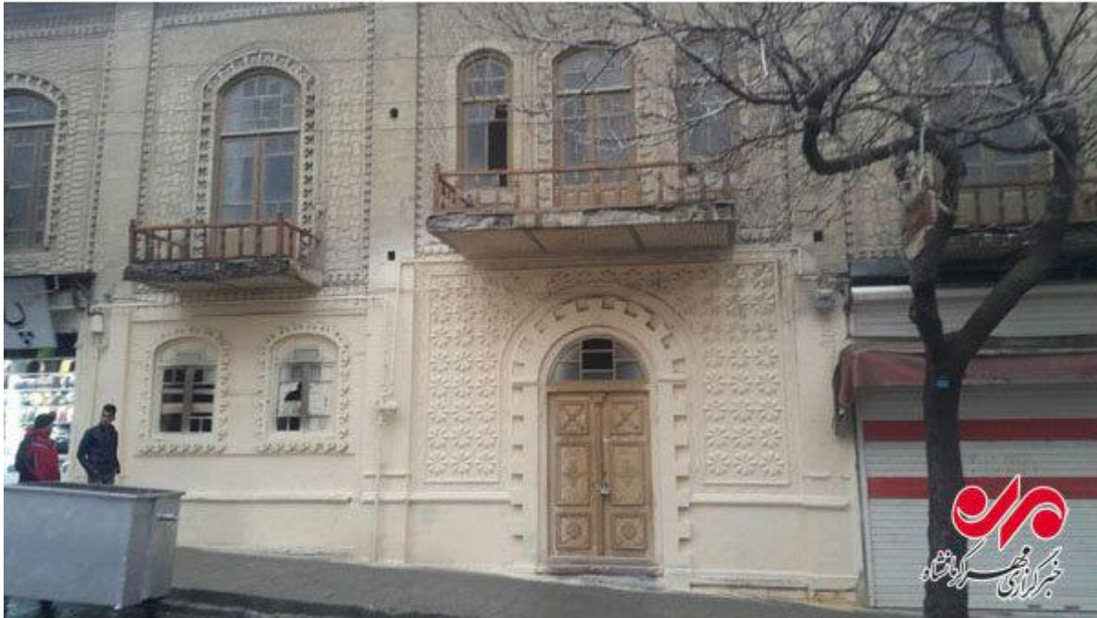
عکس ۲: خانه ای در کرمانشاه