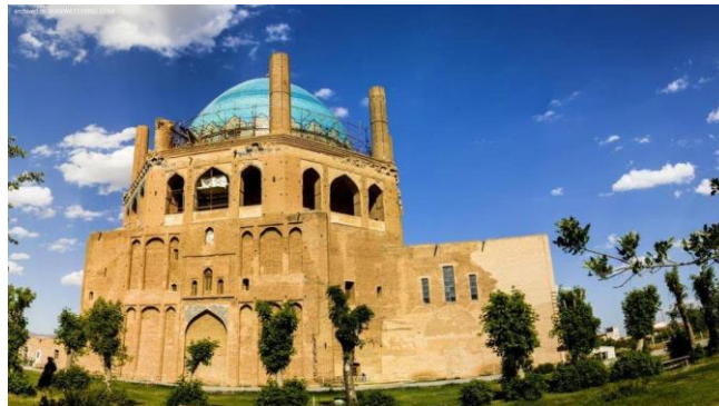
شکل شماره (۱): گنبد سلطانیه

شنب غازان، ربع رشیدی، رصدخانه مراغه، مسجد علیشاه تبریز، مدرسه و تکیه امیر چخماق، مسجد جامع ورامین، مسجد کبود تبریز، گنبد سلطانیه، مدرسه امامی اصفهان و مقبره دختر ارغون در سلماس (میریخت، ۱۳۹۴).