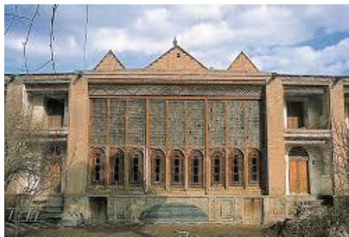
شکل شماره (۴): خانه امینی ها