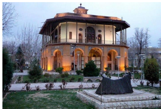
شکل شماره (۲): عمارت چهل ستون قزوین - منبع:

ساخت گوشه های پخ از معماری صفویه رایج تر شد و پیمون بندی و بهره گیری از اندام ها و اندازه های یکسان و سادگی طرح در نمای بناها نیز آشکار گردید. راه اندازی و ایجاد تأسیسات و تجهیزات زیرساختی و جایگاه نقوش هندسی در معماری صفویه ارزشمند بود. از مهم ترین ویژگی های تزئین بنا در معماری صفوی می توان به تبعیت از قاعده های تقارن انعکاس تکرار و نظم هندسی اشاره کرد. ضرورت تغییر شکل به شکل های کوچک تر تکرار یا تقسیماتی از آن به انگیزه ی نشان دادن عمق و حرکت در دنیای دو بعدی از آن جمله اند (آقاجانی، ۱۳۸۶).